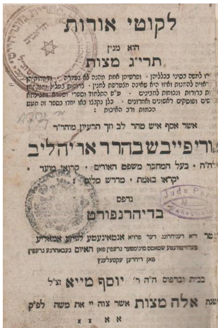
צילום שער ספר לקוטי אורות. מאוספי ספריית הרמב"ם (בית אריאלה) בתל אביב.