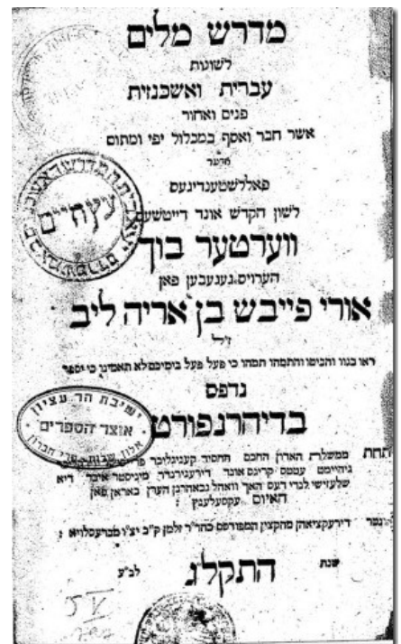
צילום שער ספר מדרש מילים. מאוספי ישיבת הר עציון באלון שבות.

ספר משפט האורים הוא ספר הלכה המחולק לארבעה חלקים בסדר מקביל לזה שב"שלחן ערוך" למרן יוסף קרו, אך הוא כולל גם הלכות ומנהגים שלא נמצאים בש"ע או בהגהות הרמ"א. כל חלק מחולק לסימנים אך הם אינם תואמים את אלו שבש"ע. לפי א"מ פינר (ראה להלן) המחבר "קיבץ כל הדינים מבוארים לפי פוסקים הן בכלל ופרט והכל בדרך הלכה פסוקה ע"פ הכרעת הפוסקים האחרונים". במבוא לספר כתב המחבר: "וקראתי שם הספר הזה בכלל משפט האורים כי הוא ... פסק דין של אורי שהוא שמי ... ויען כי החלק הראשון הכולל דברי "ארח חיים" הוא הצריך לכל יהודי ... קראתיו אור יהודים . והחלק השני הכולל דברי יורה דעה אינו שוה לכל נפש רק ליודעי דת ודין לכן קראתיו אור ידועים והחלק השלישי ... אכן העזר בו דיני נשים הנותנות יקר לבעליהן לכן קראתיו אור יקרות, והחלק הרביעי ... חשן משפט ... קראתיו אור ישועות". בתחתית העמוד מדור נפרד בשם "אורים גדולים" ובו מראי מקום והערות.