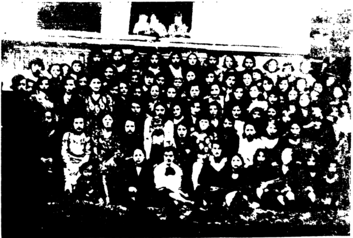
חלמיות בית ספר "בית יעקב" בבורשה