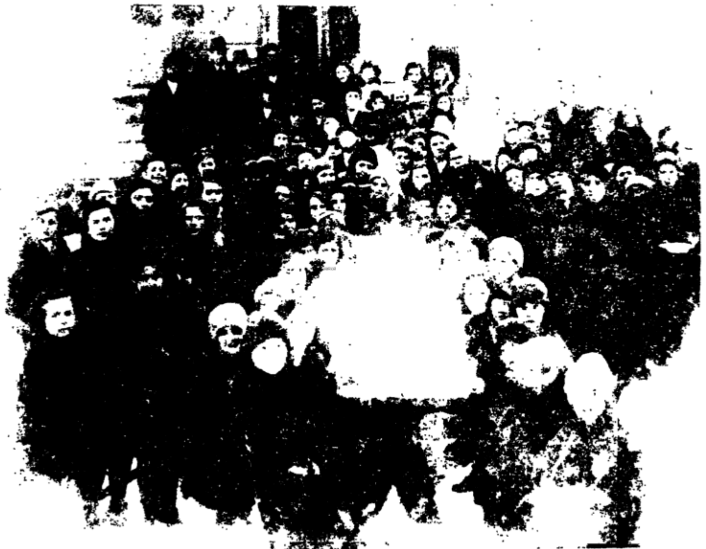
בית ההבטלה לילדים בטעם ה"גיינז"