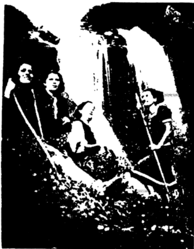
קבוצת נערות במפל מים בהר "פיאטרוס"