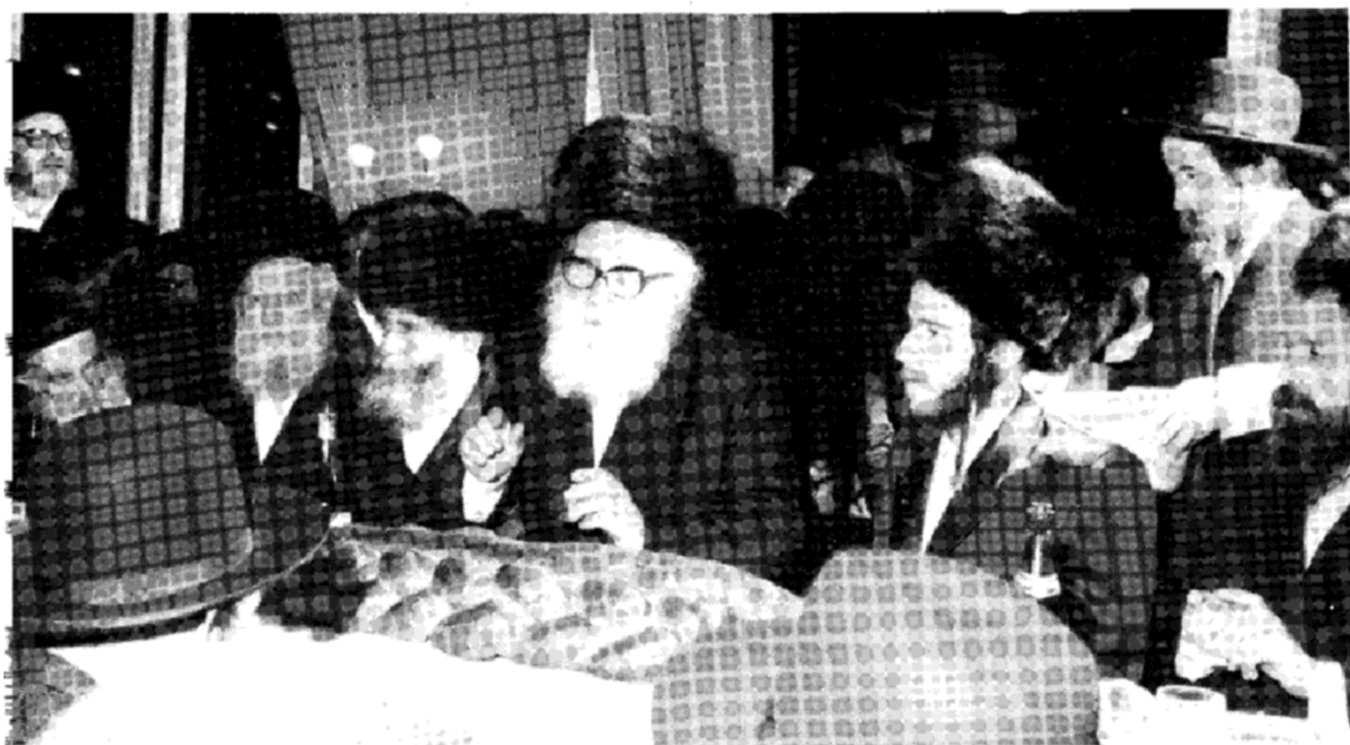
האדמו"ר ה"לב שמחה" ולהבחל"ח כ"ק מרן האד"ש