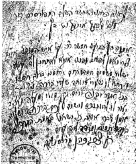
מכתב בחתימת יד קדש רבי צבי הירש מרימנוב

רבי צבי הירש הכהן מרימנוב. בן רבי יהודה לייב, נולד בדומברובא בשנת תקל"ח. נפטר לי חשון תר"ז. חתן רבי חיים גרייצער, בזיווי"ש חתן רבי אלחנן מבילגורייא, ובשלישית נשא את בת הנגיד רבי דוד לייב מרימנוב. נתייחס בילדותו והתפרנס למחייתו מאומה נות החייטות. בהיותו בן ט"ו שנה נקלע רבי אברהם משה "הגדול" מפשעוורסק לטורנא (שליד דומברובא) ועל ידו נתפס לחסידות. נדד לפריסטיק והיה משמשו של רבי מנחם מענדל מרימנוב שחבבו מאד יותר מכל תלמידיו. ארבעת עשרה מבניו ובנותיו נפטרו על פניו. גם אחר פטירת רבו זה המשיך לנסוע אל רבי נפתלי צבי מרופשיץ, ולאחר פטירתו, בשנת תקפ"ז, החל להתפרסם בצדקותו וכבעל מופת, ורבים מצדיקי הדור נסעו להסתופף בצילו. תורתו ותולדותיו בס' "מבשר טוב" ו"בארות המים".