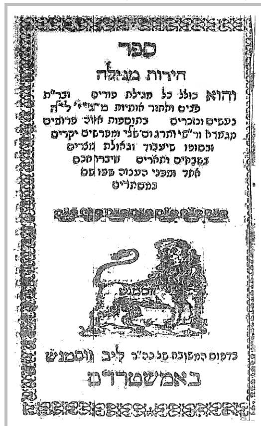
חידות מגילה – אמשטרדם [תקכ"ה?]