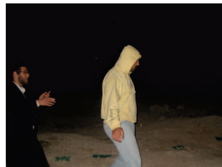
אחד הבריונים מניע לטלך את הרבנים

לזאת התעוררו מגדולי הרבנים ומורי ההוראה שליט"א, וביום שני כ"ד אד"א העעל"ט, ירדו למקום הגאונים הצדיקים מבני ברק חברי הביד"צ של הגר"נ קרליץ