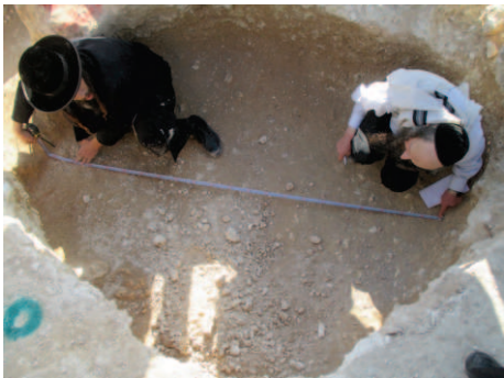
אברכים משני הצדדים מודדים את אחת המערות

אין זאת, אלא שכל העת שיקרו ביודעין אצל הרבנים, ועל סמך כזביהם ונכליהם התירו את האסור, וכפי שכותב הרב המתיר בתשובתו החדשה וז"ל: "ואמנם כהיום הזה שכבר גמרו לבדוק כל המערות בשטח של אגודת בנין שלם שבמתחם גולבנצ'ין ונתגלה שרוב רובם של המערות הם קטנות וא"א להכניס בהם מת מושכב כדרכו, וכן מתוך כל המערות שנבדקו עד עתה בשטח של גבעת ירושלים ג"כ היו רוב רובם של המערות מערות קטנות שא"א להכניס בהם מת מושכב כדרכו", שקר גם שהתפוצץ השבוע לרסיסים בקול רעש גדול, ושבעטיו ובעטיים של שקרים רבים אחרים, רדפו עד חרמה ושפכו דמם של אברכים יקרים ת"ח שלחמו במסי"ג למען שלמותם של