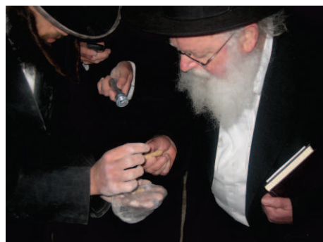
הרבנים נחרדים למראה העצמות שהתגלו באחד המערות

באותה עת ממש, נמצאו בשטח כמה מחברי "ועדת ההיגוי" החדשה (שורץ וגלבר), שעסוקים היו במדידת המערות לעיני המסרטה (על מנת להוכיח שמדובר במערות קטנות). בעודם עסוקים במלאכתם, נדהמו לראות את שיירת הרבנים מסיירת לה מעדנות בביה"ק... מיד מיהרו להזעיק את פלאי האחראי על השומרים, שזעיק את בריוניו לטפל באורחים הבלתי צפויים והבלתי רצויים, אך מן שמים נלחמו הכוכבים ממסילותם, והשומרים מרוב דחיפות ובהלה, לעצור