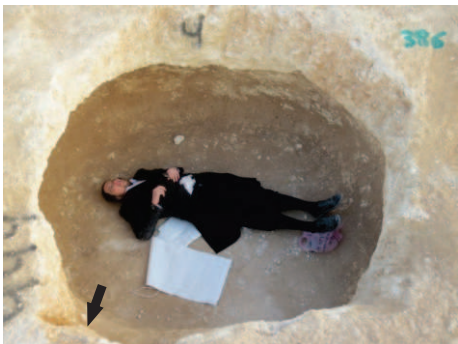
מערה שגגה הוסר, ניתן להבחין את תחילת אבן הגולל בצד שמאל

וברגע האחרון, לפני שגם הנותר לפליטה יגרם וישבר במלתעות גרוזי הארכיאולוגים ושיני הבולדוזרים, פונים אנו לכל היזמים הגלויים והנסתרים, נא ונא חוסו על כבוד שמים המחולל, חוסו על כבוד המתים והחיים, תנו כבוד לאלקי ישראל והפסיקו מיד את המשך הרס וחילול הקברים בבית החיים - הנמשך בימים אלו למרות מה שנתגלה!!! ובפרט שעדיין מצויים שם מערות שלא נחפרו וכמו"כ יש עדיין שטח גדול שכלל לא נחשף וחלילה לפגוע בהם.