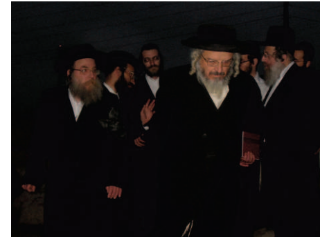
הגאון רבי מנדל לובין, הגאון רבי משה זאב זארגער שליט"א