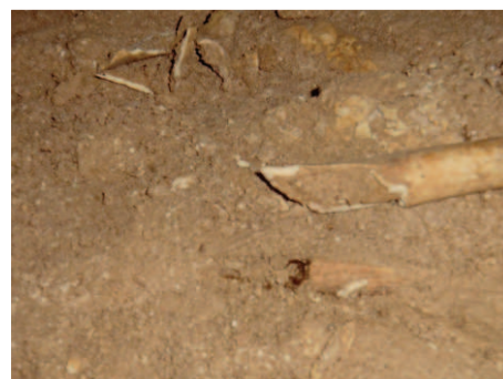
חלקי עצמות שבורות