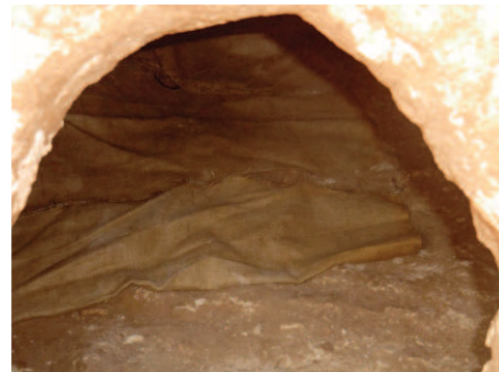
פנים המערה - השקים שנפרסו ע"י הארכיאולוגים