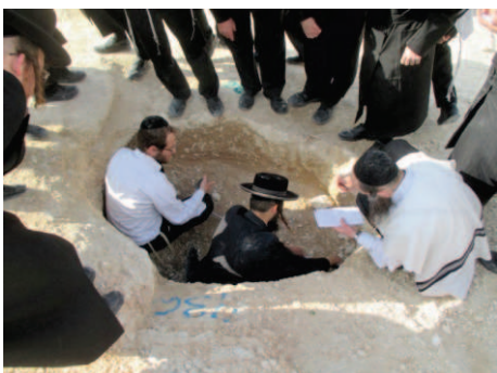
במעמד שני הצדדים, מודדים ורושמים גודל כל מערה ומערה