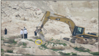
ומיד לאחר מכן הורסים את המערה (המערה הנ"ל)