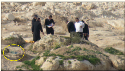
בדיקות חוזרות ביום ה' (מערה שסומנה על ידם מס' 230)