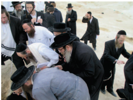
הרבנים שליט"א, עוקבים אחרי המדידות

ואז הוחל במדידת המערות, כאשר בכל מערה ומערה נכנסו שני מודדים אחד