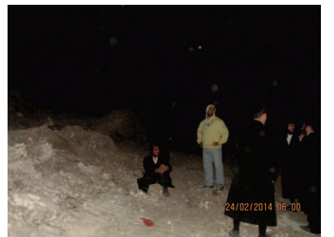
תרגיל ההטעיה, אברכים בצדו השני של בית החיים

והנה אחד הכזבים שהפיצו זה כמה חדשים, שרוב רובם של מערות הקבורה, הן בשטח "בנין שלם" והן בשטח "גבעת ירושלים" הם מערות קטנות, שלא יתכן לקבור בהם 'מת מושכב כדרכו', וכאמור