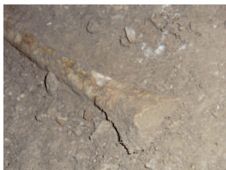
עצם רגל שלימה