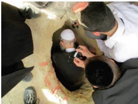
כ"ק אדמו"ר דקהל חסידי ירושלים שליט"א נכנס לאחת המערות