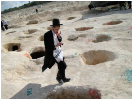
האם המרחק בין מערה לחברתה, רחוקים יותר מ-ח' אמות?!

הקברים, ביזו את הרבנים שהעיוז להשמייע דעת תורה, ושמזו ללעג ולקלס את פסק מרן הגאב"ד והביד"צ שליט"א שכתבו כי "אסור לחרוש או לחפור במקום זה".