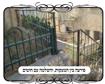
פירצה בין המעקות, והשלמה עם חוטים

והנה יש מקומות שבעיה כזו לא נקראת כשלון, שהרי כנראה יש איזה גדר מאחורה, רק שם יש שאלה, וכאן זו רק שאלה, וא"כ יתקן ויעבור הלאה. ולכן יש מקומות שאומרים שהעירוב מהודר ואף פעם לא היתה בו בעיה,