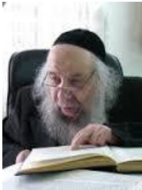
דער ראש ישיבה זצ"ל זאגט א שיעור