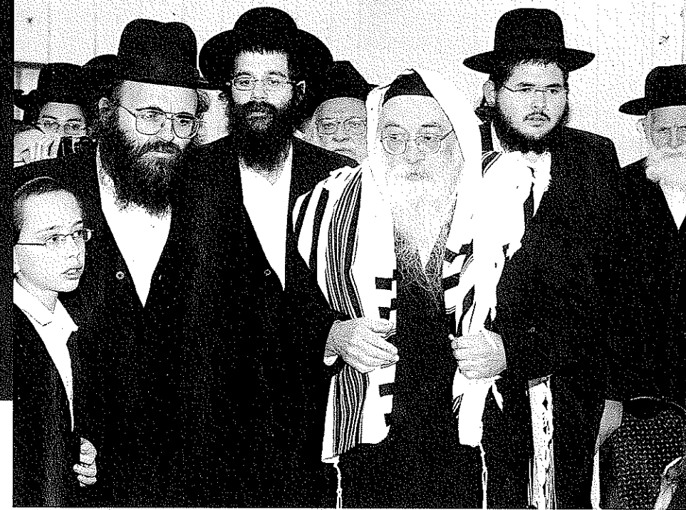
ישיבה שהשתרעה על פני בני ברק, זכרון יעקב ותפרה. עם בני משפחה ותלמידים