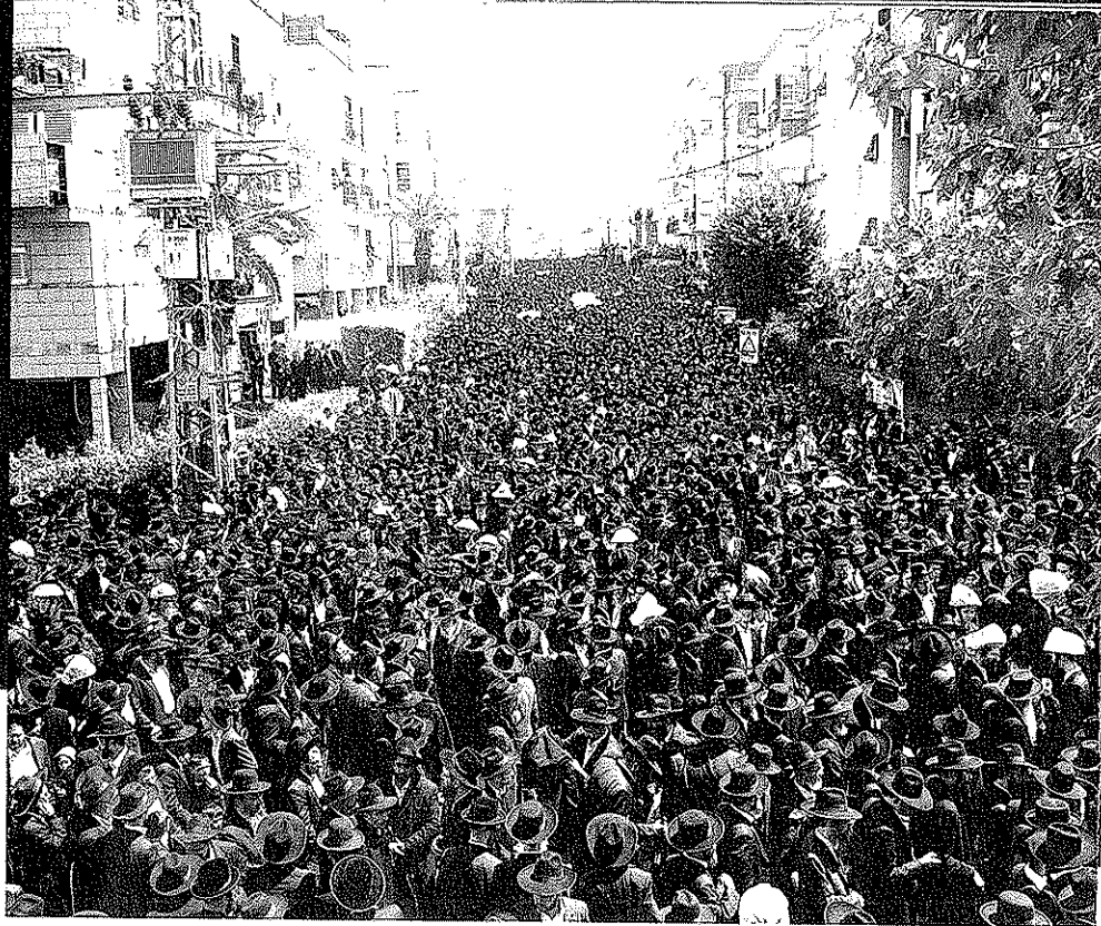
עשרות האלפים במסע ההלוויה

לא 'שטאנץ'. מי שמעוניין ומוכן להקריב - ירכוש בה דרך חיים. זו כוללת גם טיולים ב'בין הזמנים' שמנוצלים גם להעשרת הידע הכללי וללכידות החברתית.