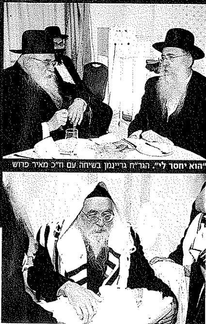
בסנדקאות עם אחד מניניו