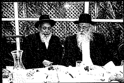
עם הגר"ש בעדני שליט"א