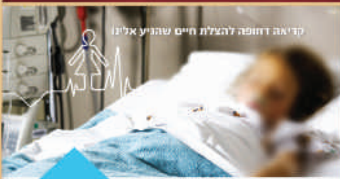
קדימה דחופה להצלת חיים שהגיע אלינו

במלחמה הזאת אנחנו חייבים לנצח! מחזירים עכשיו את הבנות שלנו הביתה!