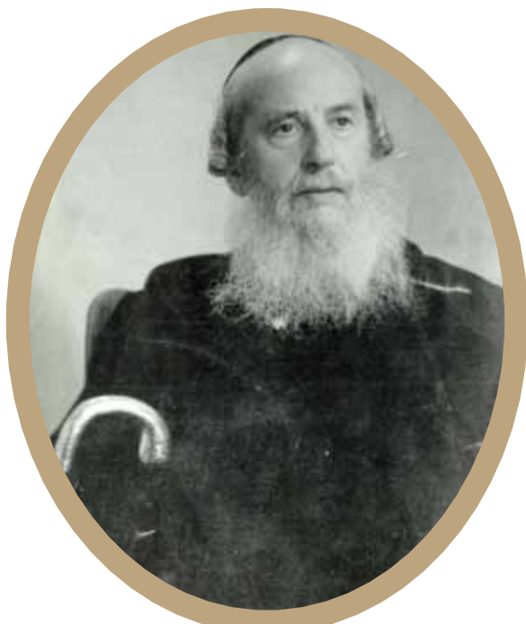
הגאון רבי חיים יהודה לייב אויערבאך (חתן ר' שלמה זלמן פרוש)