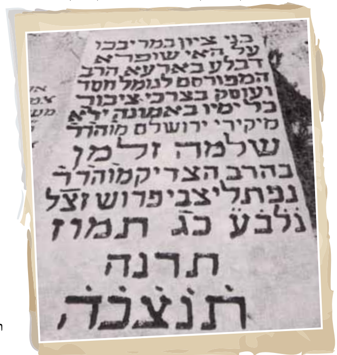
מצבת רבי שלמה זלמן פרוש