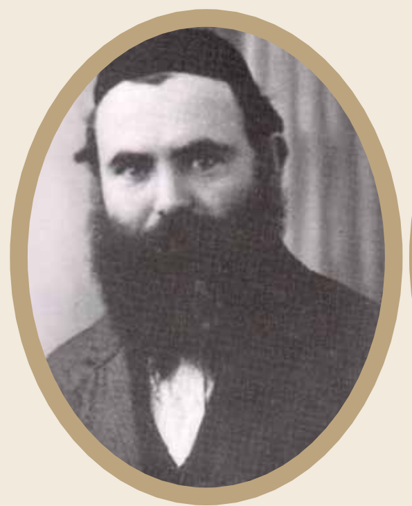
ר' אברהם דב זוננפלד (חתן ר' נפתלי צבי פרוש)