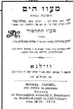
שלושה ספרים נפתחים