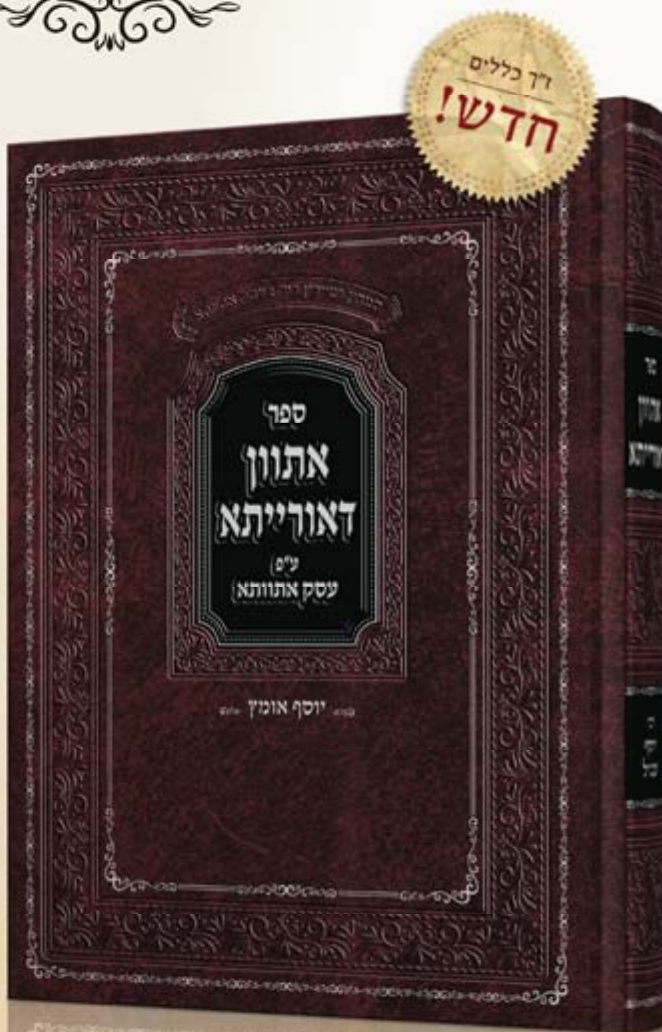
אודות ה"עסק אתונתא":