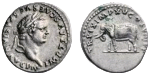
Denarius Titus (TR P IX IMP XV COS VIII P P) (79-80)

מצורף בזה מטבעות מימות טיטוס סוף בית שני ומשקלם 3.2 גרם.