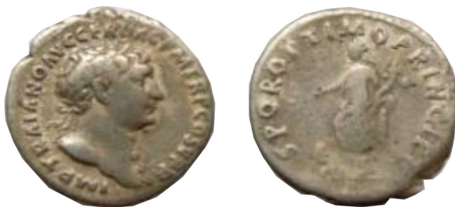
Denarius - Trajanus (SPQR OPTIMO PRINCIPI) (103-111)