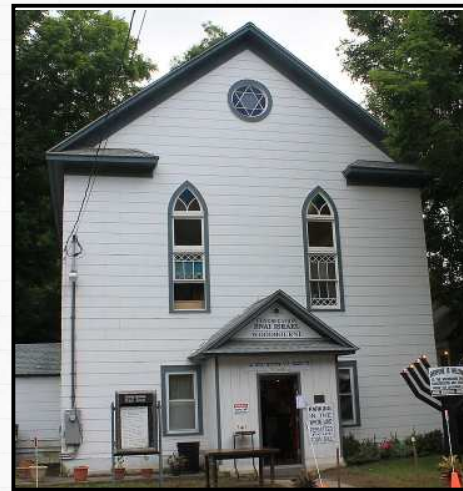
ביהמ"ד בני ישראל דוואודבורן

בעמדינו בגמר ימי הקיץ ומתכוננים בעזהשי"ת להיכנס לימי הרחמים והרצון הבעל"ט, שהוא עת זמן שהרבה מאחב"י מסיימים עכשיו את ימי הנופש בהרי הקעטסקילס אשר במרומי מדינת ניו יארק, בוודאי שהוא דבר בעתו לעמוד ולהנציח את זכרו של אחד ממייסדי הקהלות החשובות בהרי הקעטסקילס ומחשובי רבניה, קהלה