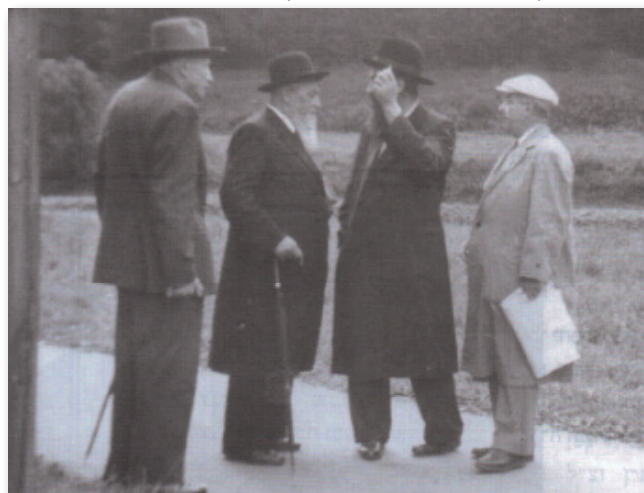
רבנו זצ"ל משוחח בלימוד עם רבו מרן הגרי"ז זצ"ל בעיירת המרפא 'שולץ' בשווייץ - אב תשט"ז

דרך רצופה ניסים רבים עבר רבנו זצ"ל במהלך בריחתו מליטא למוסקבה, ומשם דרך לבנון וטורקיה עד הגיעו לחוף מבטחים בארה"ק ימים ספורים קודם חג הפסח תש"א. מעשה פלא אותו סיפר רבנו זצ"ל בערוב ימיו על השגחה פרטית שאירע לו, במהלך מנוסתו מליטא לרוסיה ברכבת. בשעה שעמד לעבור את הרציף לכיוון הרכבת חמד חייל נאצי את מעילו של רבנו ותפסו בידו כשהוא מצווה עליו שיעמוד בצד ולא יעלה לרכבת, רבנו נתן לו דחיפה הגונה כשהחייל נופל על פניו ארצה, ועד שהתאושש הספיק רבנו לרוץ לכיוון הרכבת, יושב במרומים שמר על רבנו שהחייל לא ירה לעברו.