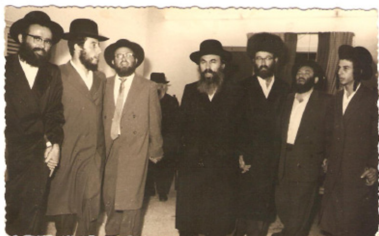
תמונה נדירה. רבנו זצ"ל בריקוד של מצוה בשמחת נישואין לפני יובל שנים