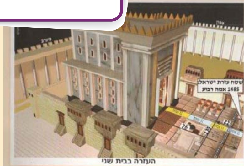
העזרה בבית שני