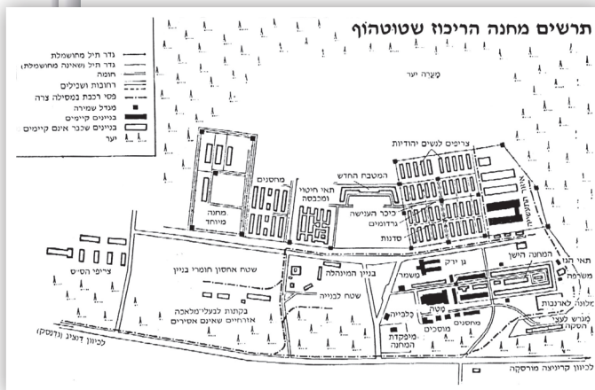
מפת מחנה שטוטהוף

הגנרל בובליס היה אחד מן הגנרלים הליטאים שהקימו את המחתרת הליטאית הפרטיזנית נגד הרוסים, ולמעשה בעזרתם כבשו הגרמנים את כל ליטא במשך יומיים - שלושה. בעת הכיבוש הגרמני הוא היה המפקד הצבאי הליטאי בקובנה, ועשרות אלפי אנשי המחתרת והצבא היו תחת פיקודו.