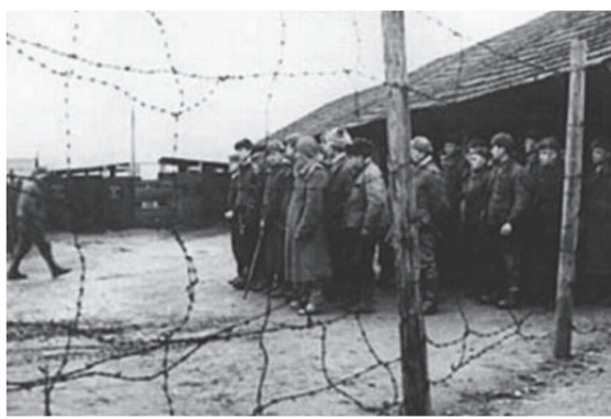
האסירים במחנה שטוטהוף

מאד מבולבל מהניסים שקרו לי במשך השעות האלו. למעשה, אנשי הקאפו כנראה ידעו מה זה תפילין ולא נגעו בתפילין של אבא. כשיצאנו החוצה, כל הנערים הוכנסו בחזרה לצריף ואנחנו נשארו במגרש לפני הצריף. התחלתי לחפש באדמה את התפילין ולא מצאתי. היה בכך סיכון רב, מפני שמעלינו היתה עמדת שמירה של אנשי ס.ס. ואם הם היו מבחינים שאני חופר באדמה הם היו חושבים שהחבאתי שם אוצר של זהב. כמו כן, אנשי הקאפו יכלו לראות דרך החלונות שאני מחפש באדמה. כמו כל הניסים שקרו לי, גם הפעם השומרים