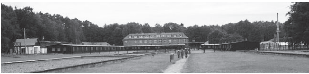
מחנה שטוטהוף כיום

קיבלנו בגדי מחנה נקיים, ואת הנעליים היינו אמורים לחפש בערימת הנעליים שהשארנו לפני שנכנסנו להתרחץ. כל אחד לקח את הנעליים שלו או נעליים אחרות לפי מידתו. כפי שתיארתי, נכנסנו להתרחץ בקבוצות קטנות וכל אחד היה יכול למצוא