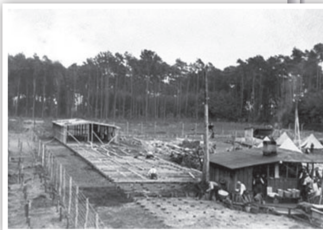
עובדים במחנה שטוטהוף

אחי הגדול ממני בשנתיים הצטרף תיכף למשלוח עם אבא. גם אני רציתי ללכת עם אבא כדי שנוכל לדאוג אחד לשני, והעיקר - לא להיפרד מאבא שהיה אדם מבוגר וחולה לב ולא היה מסוגל לעבודות קשות. לא עלתה אצלי המחשבה שאולי כדאי להשאר עם הנערים בעבודה יותר קלה. עד עכשיו כמעט לא עבדתי עבודה פיזית והייתי חלש ביותר בעקבות הרעב האיום והמכות במחנה שטוטהוף. חברי בני גילי בחרו באופן חופשי להשאר עם הנערים ובפרט כאשר אנשי הקאפו ברשעותם ובזדון ליבם הציעו להם להשאר במחנה הנערים וכך יהיה להם יותר טוב. לפתע, אנשי הקאפו נעשו יותר אנושיים כלפי הנערים, כנראה בציווי הגרמנים אנשי ה.ס.ס., כדי להרדים את חושיהם של הנערים ולגרום להם להסכים להשאר במחנה.