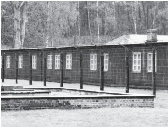
הצריפים במחנה שטוטהוף

והתחילו ללמד אותנו איך לעמוד באפלים (מסדרים). הם ציוו עלינו שתוך שניות ספורות מהפקודה לאפל, כבר יעמדו כולם בשלישיות במרחק שווה ובצורה ישרה, ושום דבר לא יבלוט - לא יד ולא רגל. כך, הגרמני הנאצי שיבוא לספור יוכל לעמוד בתחילת השורה, יראה את כולם לאורך כל השורות ויהיה לו מקום לעבור גם בין השורות. נדרשנו לעמוד כמו אנשי הצבא הגרמני, ועד שלמדנו לעמוד בצורה כזאת קיבלנו מכות רצח. אנו, האחים, תמיד עמדנו משני הצדדים של אבא כדי לשמור עליו מהמכות של הקאפו. פעם, באחד המסדרים, עבר הרוצח איש הס.ס. בין השורות, והעמידה של אבא לא מצאה חן בעיניו. הנאצי הגרמני ניגש מאחור לאבא ונתן לו מכה איומה עם המקל בעמוד השדרה. אבא כמעט התמוטט מעוצמת המכה, וחודשים לאחר מכן עוד סבל מכאבים בגב.