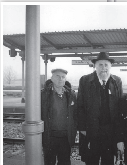
המחבר בביקור בתחנת רכבת

בשנת היובל לשחרור המחנות בקרתי גם בתחנת הרכבת בקאופרינג. רציתי לבקר בכל מקום שהיה לי בו נס. ישבתי בתחנת הרכבת שנשארה באותו מצב עם השלט "קאופרינג". כל הקבוצה המשיכה להסתובב בעיר, ואני נשארתי כל הזמן בתוך התחנה וברכתי ברכה על הנס שהתרחש עמנו כאן. הודיתי לבורא עולם על כך שזכינו לנס הגדול במקום הזה.