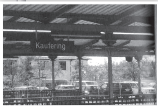
תחנת הרכבת קאופרינג

ידענו שגיהנום כמו זה שעברנו במחנה שטוטהוף במשך חודש שלם לא יחזור על עצמו יותר. הבנו שבמחנות העבודה יש רעב ועבודה קשה, אך אין יותר אקציות של משלוחים לאושוויץ ולשאר מחנות ההשמדה. לאחר נסיעה קצרה בקרונות הפתוחים הגענו לתחנת הרכבת, ושם היו מוכנים קרונות משא סגורים. בכל קרון הכניסו כחמישים איש, ואנו עברנו לפי הסדר מקרון לקרון כדי לא לקבל מכות מאנשי הס.ס.