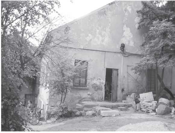
בית הכנסת החסידי בקובנה כיום מבחוץ