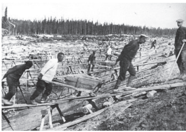
בונים את מחנה שטוטהוף

גם הסטודנטים הצטרפו לשכנועים כאילו מתוך אהבה אלינו, ואמרו שזה באמת משלוח לעבודה קלה של עבודת אדמה.