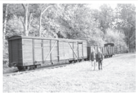
קרונות הרכבות שנשארו במחנה שטוטהוף כיום

בעת חיסול גטו קובנה נשלחו שלושה משלוחים מהגטו לגרמניה. שני המשלוחים הראשונים מהגטו עברו ליד המחנה האיום שטוטהוף ושם הורדו חלק מהנשים ומהילדים עד גיל שתים עשרה, ואילו שאר אלפי האנשים נשלחו ברכבת למחנות העבודה של קאופרינג - שם הוקמו אחד עשר מחנות עבודה. אנשי גטו קובנה נשלחו בעיקר למחנה מספר 1 שניצב סמוך לעיר לנדצברג.