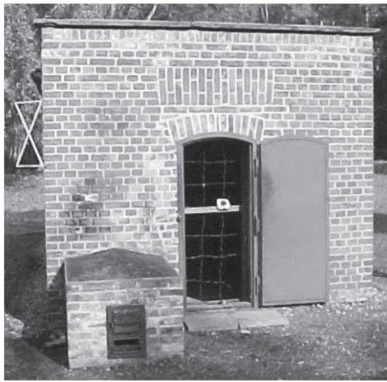
המשפחה במחנה שטוטהוף כיום

חלום כזה, אך מפליא הדבר שהחלום היה בדיוק ביום הפטירה. הייתי הילד הכי קטן במשפחה והייתי מאד קשור אליה, לקחו לי שנים ארוכות עד שהתאוששתי משיברון