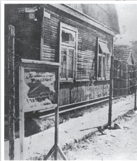
הגדר בגטו קובנה

זו היתה דמותו של קאפו רוצח שם במחנה: מצד אחד הוא רוצח סאדיסט שנותן מכות איומות כדי