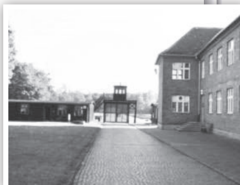
מראה מחנה שטוטהוף כיום

אבא הבין שאם לא יסכים לתת ברצון את מגפי העור שלו, הקאפו יקח אותם בכוח ואז אבא ישאר ללא נעליים כלל. אבא הסכים מיד ורק ביקש שיביא לו נעליים טובות לפי מידתו. הקאפו נתן פקודה לקאפו של הצריף שיוסיף לנו כל יום בצהריים את מנת המרק שלו. היתה זו השגחה פרטית מיוחדת, וכך זכינו מן השמים לקבל במחנה הרעב האיום עוד מנת מרק יום יום במשך כמעט חודש. בשטוטהוף לאף אחד לא היתה זכות לקבל אפילו עוד כפית אחת של מרק. הקאפו הבטיח שמחר הוא יביא נעליים לאבא. אנו יצאנו