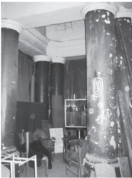
פנים בית הכנסת החסידי בקובנה כיום צולם ע"י א' צ' קיץ תשע"ג

שטוטהוף היה אחד המחנות הכי קשים וידועים בעיוניים בגרמניה. כל יום הגיעו אנשי הקאפו עם המצאה חדשה כדי לענות אותנו. איני יודע אם זו היתה פקודת הגרמנים אנשי הס.ס., או שזה היה מצד אנשי הקאפו שהיו ממונים עלינו. דבר אחד יש