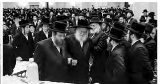
רבינו שליט"א באטייליגט זיך ביים עצרת חסידים אין בארא פארק אויף די הסתלקות פונעם גרויסן פוסק הגאון הגדול בעל שבט הלוי זצ"ל