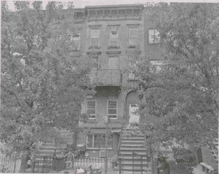
בית המדרש נתיבות עולם אויף 205 יו סטריט - אַן קיין שילד, לויט'ן באַפעל פונעם מלאך