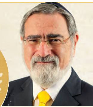
| הרב יונתן זקס |