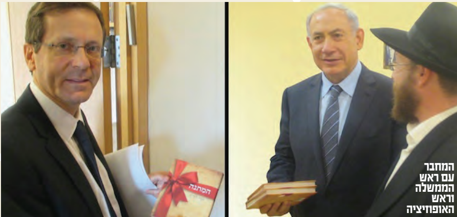
המחבר עם ראש הממשלה וראש האופוזיציה

"בעולם הצדקה נהוג שמנהל העמותה הוא קדוש, וכשאתה נותן לו את הכסף אתה לא יכול בדיוק לברר להיכן הוא הולך. אני מנסה לערער על הדבר הזה. כשאדם נותן יש לו את הזכות המלאה לדעת לאיפה הולך ומה בדיוק עשו עם הכסף שלו"