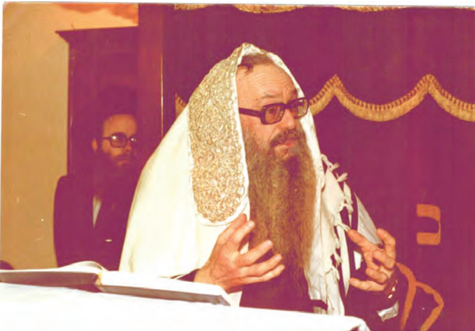
דורש בביהמ"ד המרכזי בג'נבה בשנת תשל"ט

"כל מילה מיותרת בפירוש סעיף זה, דהיינו ששום גבאי וראש הקהל, או אנשים תקיפים וכדו' לא יעזו להביע את דעתם בענייני האידישקייט שבקהילה בשום אופן, ורק דעתו תורה הבלעדית היא אשר תכריע ללא כל משוא פנים, כך לא פלא הדבר שגם בהיותו שם דחה מו"ח כמה הצעות מפתות של רבנות כאשר היה מסופק אם דעתו היא אשר תכריע בענייני העמדת הדת על תילה. "אולם, שונה בתכלית היה ביחסו אל הפרט. כל מי שהגיע לביתו לבקש צדקה נענה בסבר פנים. מו"ח היה חופר בארונותיו לחפש מטבע, ובלבד שאיש לא ייצא מביתו בידיים ריקות. מעשה ובא לביתו ילד למטרות התרמה, אחד מבני הבית לא התייחס וסגר בעדו את הדלת. "מי זה היה?" נשמע לפתע קולו מהחדר הסמוך. כשסיפרו לו את פרטי המקרה, נזעק: "לבוזת יהודי? אפילו לא יעלה על הדעת", מיד פקד מו"ח על אחד מבני הבית שילך לחפש אחר הילד, כשהובא הילד בתום "מרדף" צהבו פניו, הוא העניק לו "כפל כפליים" מכפי הרגלו.