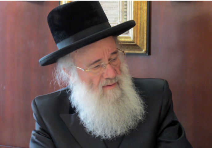
הגראי"י שלזינגר שליט"א בשיחה עם סופר 'המבשר'

ממשיך הגראי"י שליט"א ומגולל בפנינו: "בשנת תשכ"ח עבר מו"ח לכהן ברבנות ק"ק "קהל יראים" בווינה הבירה. גם כאן ארגן את מוסדות הקהילה ופיתחם לשם ולתפארת. עינו הייתה פקוחה על הכול למגדול ועד קטן תוך שהוא שימש כתובת מרכזית לכל שאלה הלכתית ותורנית שעלה על הפרק שם. "גם כאן עמד בתקיפות על כל דבר שבקדושה, ולא זו מקוצו של יו"ד כאשר הדברים נגעו לענייני עקרונות היהדות.