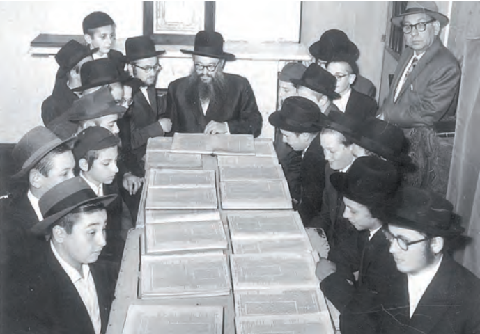
מוסר שיעור לתלמידים