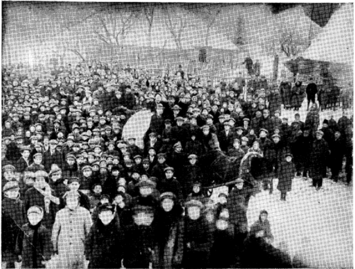
ישיבת "עץ חיים" בסלוצק שורכת גדות (בדרך לקלעצק) 1234567 תמונת