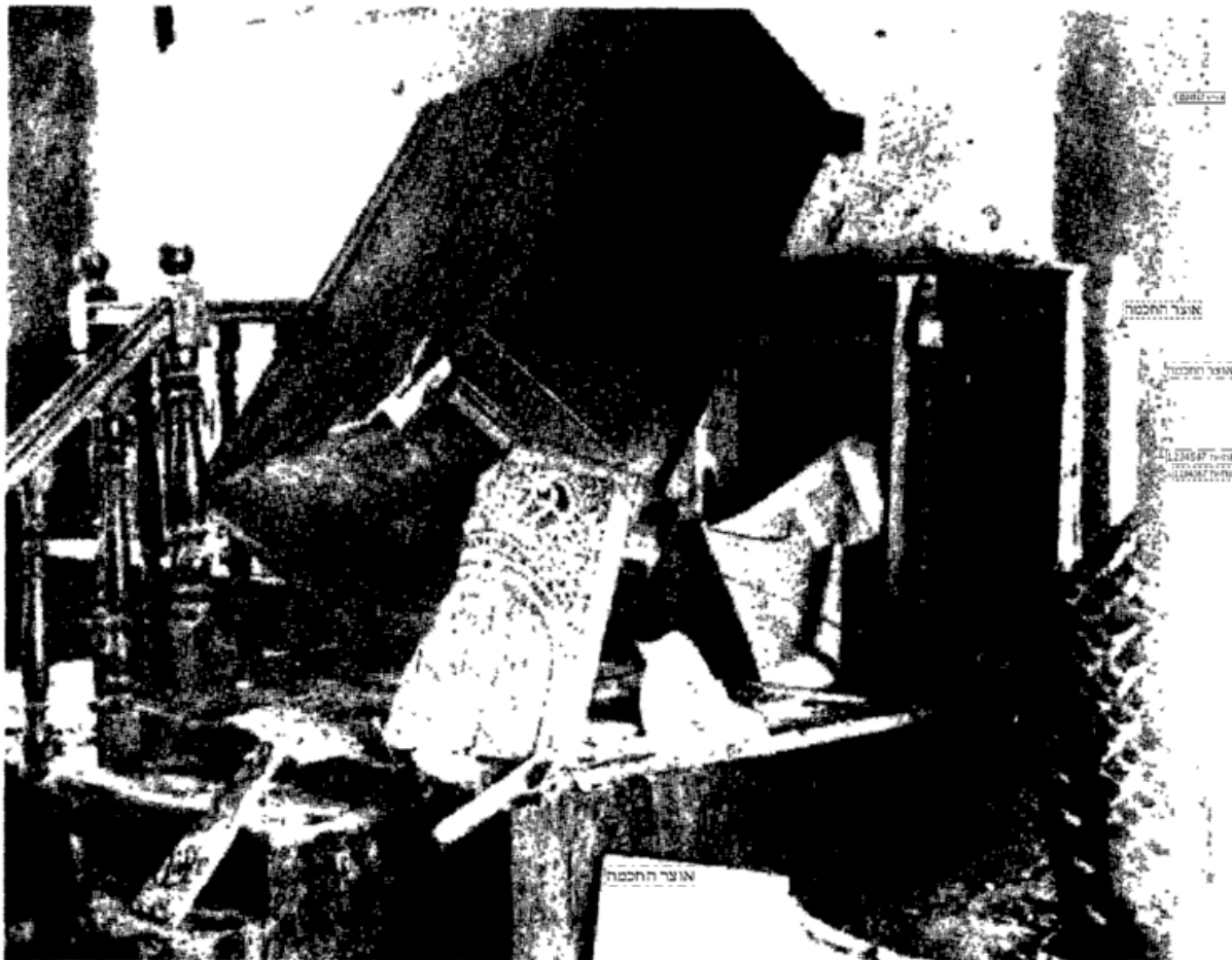
ארון הקודש החרוס וספרי התורה חקרועים בישיבה בפרעות תר"פ - 1920. (מתוך החוברת באידיש על ישיבת "תורת חיים", תרצ"ג)

מודעות כאלו פורסמו מדי שנה בלוחות השנתיים של א.מ. לונץ.