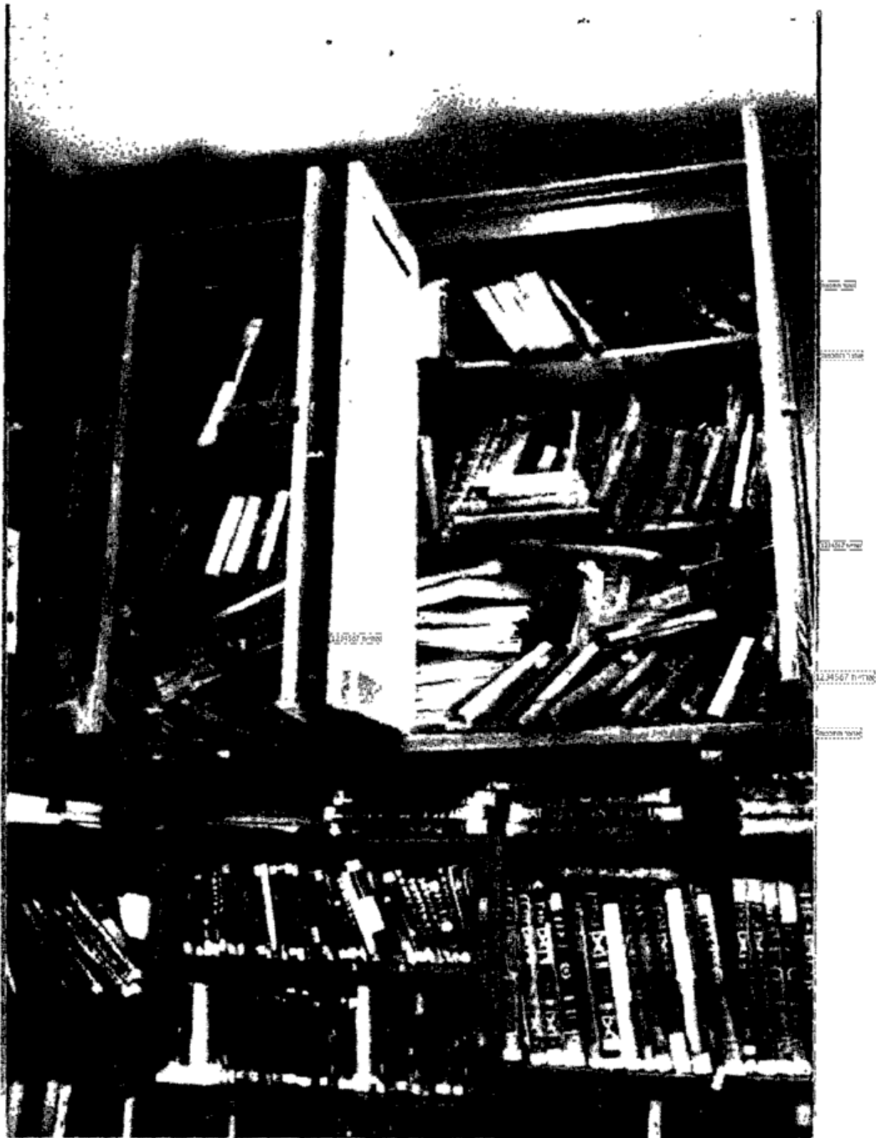
ספרי חקודש של ישיבת "תורת חיים" שנשמרו בארונות המקוריים של הישיבה, משך למעלה מ- 40 שנה עד 1967, בסיוע השומר הערבי.

מובהק - ונמסרו בו פרטים אודות הרכוש היהודי, הקיים באיזור. הושמעה קריאה לראשי המוסדות להתחיל בשיקום בתייהם העומדים חרבים ושוממים מאז ימי הפרעות של שנות תרפ"ט ותרצ"ו, והוקם "ועד פעולה" אשר יעסוק בנושא.