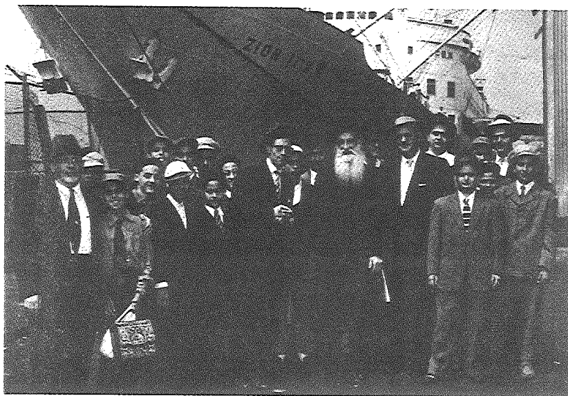
הרב קאלמאנוביץ' מקבל את פניהם של תלמידים ממרוקו

העולם השנייה הקימו הרב אברהם קאלמאנוביץ', נשיא ישיבת מיר בניו יורק, והרב רפאל עבו את רשת החינוך "אוצר התורה" במרוקו, 4 וזו התאחדה עם רשת החינוך "אם הבנים" ולקחה אותה לחסותה. 5 משנת 1947 ועד היציאה של רוב יהודי מרוקו בשנת 1962, היתה "אוצר התורה" לגורם המרכזי בחינוך המסורתי במרוקו, שהקיף כעשרה אחוזים מכלל הילדים בגיל החינוך. 6