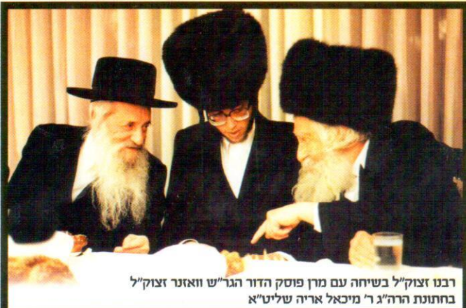
רבנו זצוק"ל בשיחה עם מרן פוסק הדור הגר"ש וואזנר זצוק"ל בחנות הרה"ג ר' מיכאל אריה שליט"א