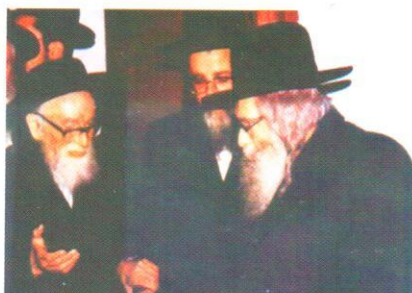
עם מרן הגאון הגדול רבי שלמה זלמן אויערבך זצוק"ל