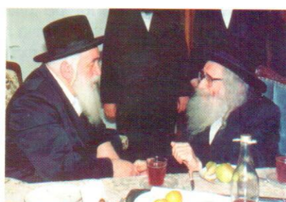
עם כ"ק מרן האדמו"ר בעל 'ישועות משה' מויזניץ זצוק"ל