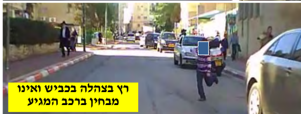
רץ בצהלה בכביש ואינו מבחין ברכב המגיע