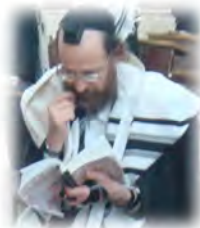
הגרא"י כהן מנצל זמנו לפני ברכת כהנים

בתי הכנסת (וגם בבתי כנסת אחרים...), ומזכה את כולם בברכתו, וגם אינו