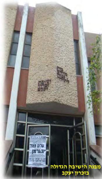
מבנה הישיבה הגדולה בזכרון יעקב