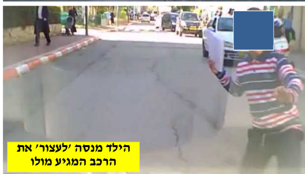
הילד מנסה 'לעצור' את הרכב המגיע מולו