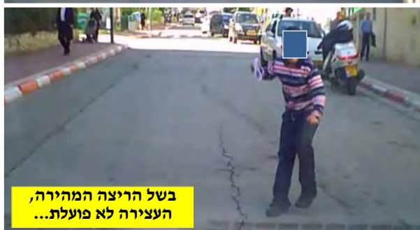
בשל הריצה המהירה, העצירה לא פועלת...