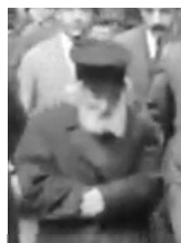
החפץ חיים בתמונה ההיסטורית

● אבל אם מדברים על אמת, ועל מידת האמת, נספר כאן שלפני זמן-מה נכנסנו לחדרו של