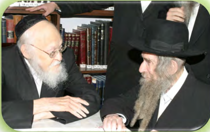
מרן הגראי"ל 'התקלס' מכוח ההכרעה של מרן הגרי"ש אלישיב זצ"ל

מי שמכיר את הדרך, יודע שמדובר במסלול לא קטן. יש לעבור קטע ברחוב רבי עקיבא, לפנות לרחוב ירושלים, משם לבעלז, ומשם לבן זכאי, ולהמשיך לעלות עד אמצע הרחוב.