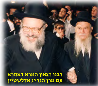
רבינו הגאון המרא דאתרא עם מרן הגר"מ אדלשטיין

צ'קנובסקי בילד כבן 3-4 והנה הוא בוכה. ממרום מעמדו התורני, ניגש אליו הרב ושאל מדוע הוא בוכה. כשהבין שיתכן שהוריו של הילד אינם נמצאים כאן, וצריך להביאו לביתו, הרים אותו הגר"מ צ'קנובסקי על ידיו, ונשאו כך ברחוב, עד לביתו במעלה רחוב בן זכאי.