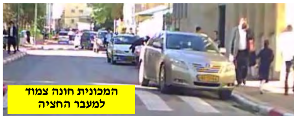
המכונית חונה צמוד למעבר החציה