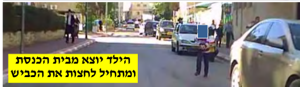
הילד יוצא מבית הכנסת ומתחיל לחצות את הכביש