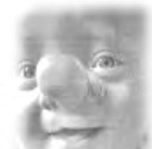
'אותו אני הכי אוהבת', אמרה האם

ולא נבראה בריאה זו של הכלכל המגיע מן התינוקות, אומר ה'תומר דבורה', אלא כדי ללמדנו את חסדיו של הקב"ה עמנו, שלמרות הכלכל הגדול המגיע מן החטא, הוא מוכן – באהבתו ובחמלתו עלינו – לרחוץ ולנקות אותנו, כמו שכתוב (ישעיה, פרק ד' פסוק ד') "רחץ ה' את צואת בנות ציון", כאותה אמא, שלעולם אינה מואסת בבנה, ותמיד-תמיד תהיה מוכנה לרחצו ולנקותו.