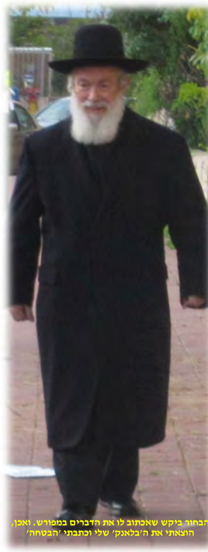
הבחור ביקש שאכתוב לו את הדברים במפורש. ואכן, הוצאתי את ה'בלאנק' שלי וכתבתי 'הבטחה'.

אמרתי לבחור ההוא, אם תקיים את מה שכתוב כאן ב'אהבת איתן', ותנצל את כל כוחותיך ללימוד תורה, ולא תבטל מזמנך על דברי-הבל, תוכל לסמוך על הבטחתו, והבטחת התורה, ואז גם אני מבטיח לך שתצליח בנישואיך. הבחור ביקש שאכתוב לו את ה'הבטחה' הזו במפורש. ואכן, לקחתי את ה'בלאנק' שלי, וכתבתי את הדברים שחור על גבי לבן, וצירפתי את חתימתי לך, תוך שהוספתי ואמרתי שמאחר שהדברים נכתבו במפורש ב'אהבת איתן' - אין לי כל בעיה להבטיח לו כדברים האלה.