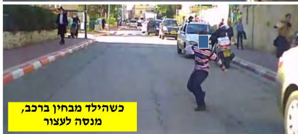
כשהילד מבחין ברכב, מנסה לעצור