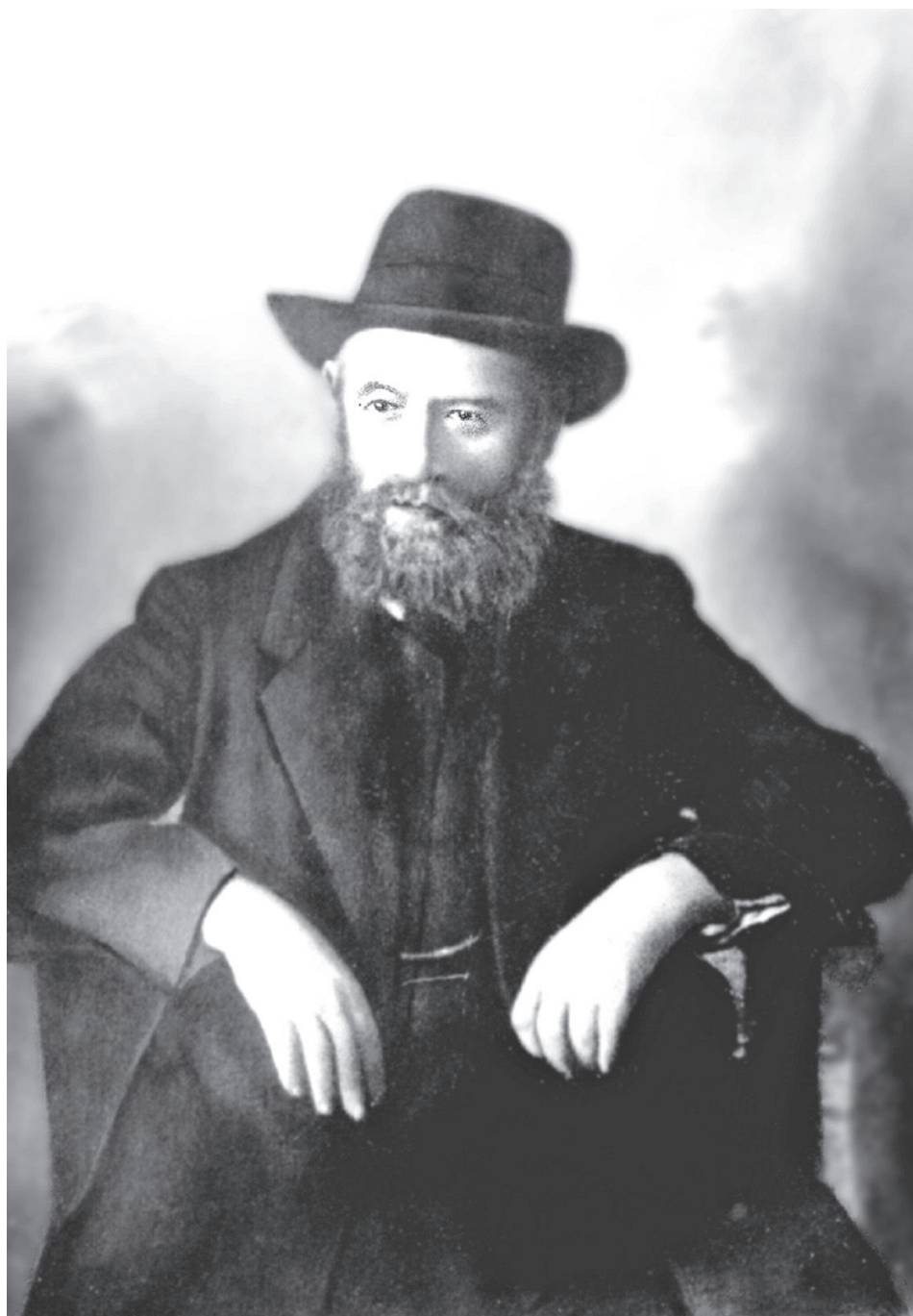
תמונת הוד כ"ק אדמו"ר מוהרש"ב נ"ע