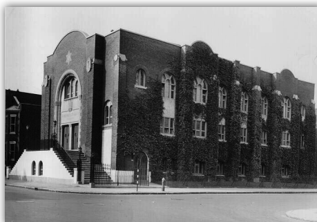
בית הכנסת 'בית יעקב' מונטריאל באחד מגלגוליו [קיים עד היום]