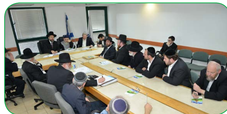
ישיבת וועדת התרופות לכסח בראשות הרבנים הראשיים לישראל שליט"א, רב הכללית ומומחי התרופות