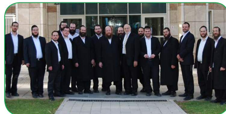
מנהלי קשרי הלקוחות של הכללית בטקס חנוכת המרכז הרפואי לילדים בביה"ח קפלן