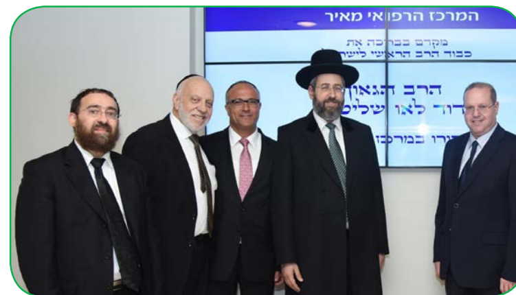
ביקור הרב הראשי לישראל הגאון הרב דוד לאו שליט"א במרכז הרפואי מאיר