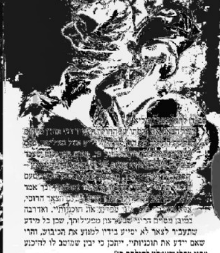
לפי גרסא זו – הפך נפוליאון את רבי משה למה שנקרא

הצרפתי כאשר חילול חומים החלו למות מרעב, מכוונות קוד' וממסעות מפרכים. ואז כאשר הצבא הרוסי הצליח להתארגן, פצח בסדרת קרבות ממושכת שהכריעה לבסוף את נפוליאון ובכאוב. הכישלון בשדה הקרב כמו גם התדרדרות העצומה בחילותיו, עשתה לה הרים בכל המדינות אותו כבש קודם לכן ואילו החלו מתמרדרות ופזרקות מעליהן את עולו של נפוליאון, כשתוך תקופה קצרה אף בארצו שלו התחוללה נגדו הפיכה, ועל כס המלוכה הושב לואי 18 – צאצא לבית המלוכה הקודם ששלט בצרפת עד תקופת נפוליאון.