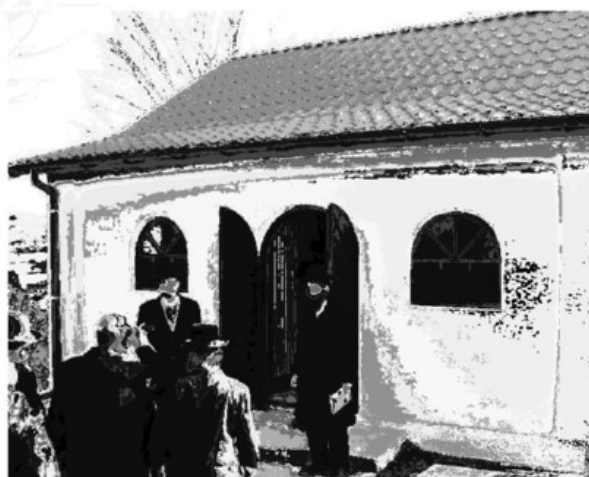
עוד חמש מאות חיילים רוסיים לתנו... אהל הר"ק רבי מנחם מענדל מרימנוב זי"ע [אנדרת אהלי צדיקים]