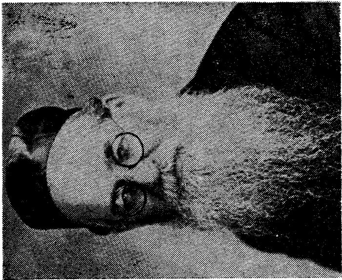
הרב חיים מישל פפסטיין