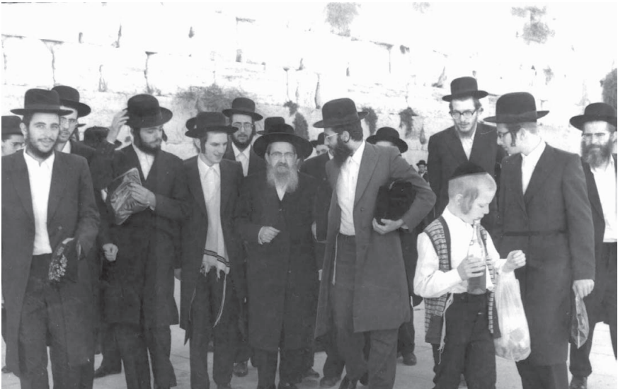
בבחרותו, עם כ"ק מרן אדמו"ר ה'נתיבות שלום' זי"ע בדרך מהכותל המערבי