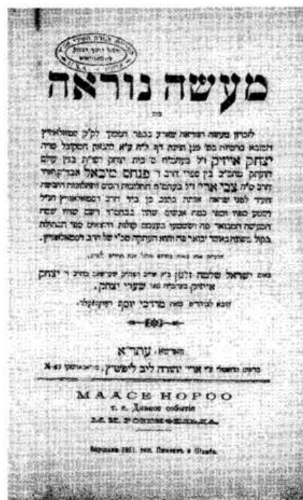
שער ספר "מעשה נוראה"

http://www.otzar.org הודפס מאתר אוצר החכמה