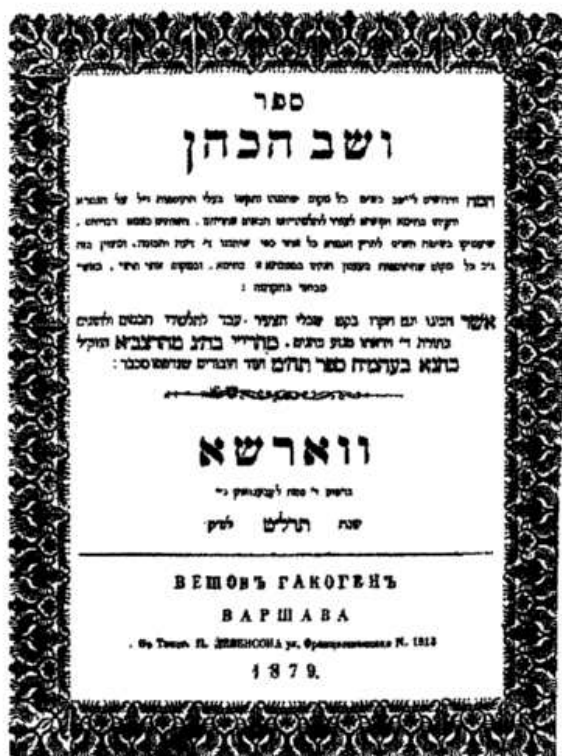
שער ספר "ושב הכהן"