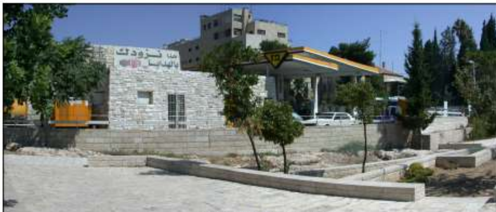
הקשר סביבתי: חזית תחנת דלק.