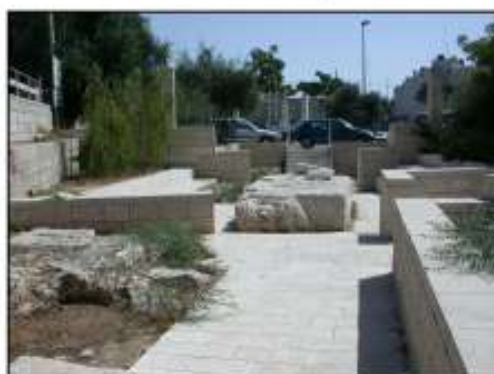
פיתוח נופי סביב האתר.