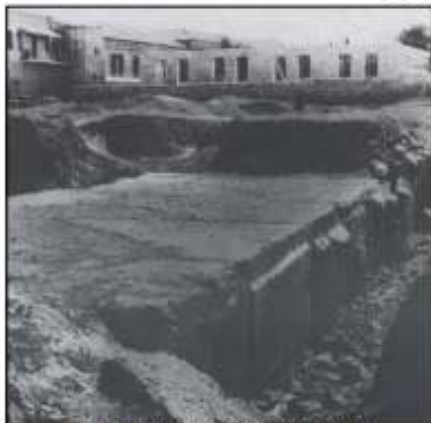
שרידי החומה בזמן החפירות.