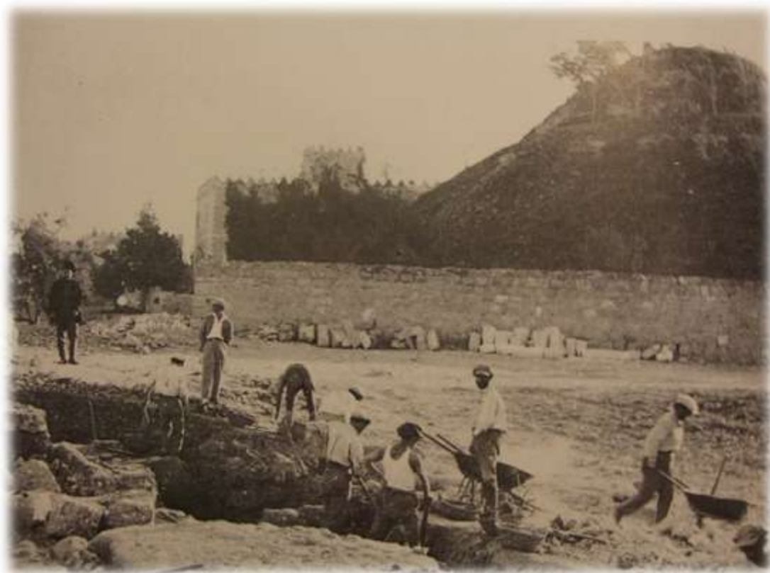
חפירות החומה השלישית בשנת תרפ"ה, מאחוריו "תל אלמסאבין"

ה. הרחוב שנמצא על שרידי החומה השלישית, נקרא "החומה השלישית", על שרידי החומה הוקמה תחנת דלק.