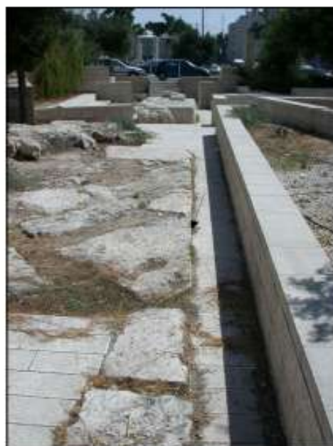
פן החומה הפנימי.