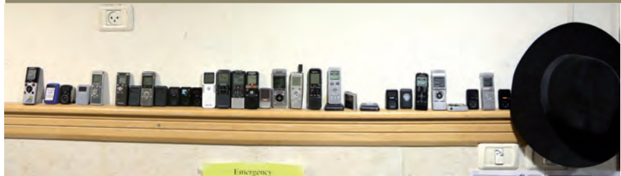
עשרות אלפים מאזינים ברחבי העולם. עמדת הנגנים בשיעור