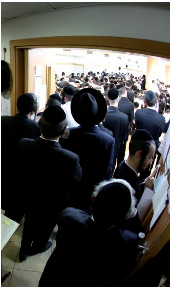
הדופק של עולם התורה פועם בישיבת מיר. התלמידים בשיעור