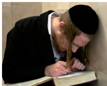
מה אמר ר' אשר על הסוגיה? תלמיד מעלה על הכתב את השיעור היומי

שעות על גבי שעות הוא יושב ספון בחדרו. יודעי דבר שביקשו לחשב את זמני לימודו, הגיעו לארבע עשרה שעות של לימוד נטו, לא כולל עשר השעות הנותרות ביממה, שגם בהן הוא לומד רבות, וזאת מבלי ליטול בחשבון את היותו איש עצה המסוגל לשוחח עם כל יהודי הבא אליו לשפוך את לבו על בעיותיו, כמו גם על חייו הפרטיים על שמחותיהם וטרדותיהם. על כל זאת ניחן בכישרון להלך בין הבריות, ועדיין למזג הכל לעמל התורה