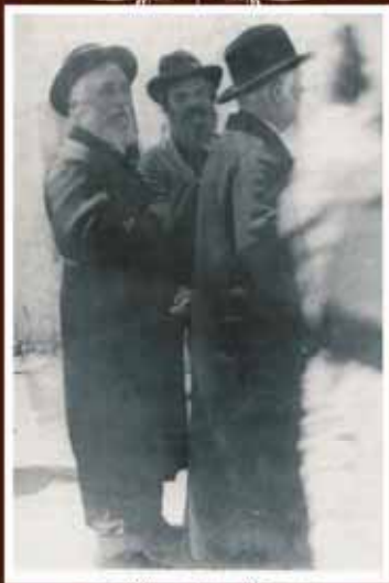
רבינו זצ"ל עם האדמורי"ם לבית ראחמיסטריווקא בכניסה לקבר רחל