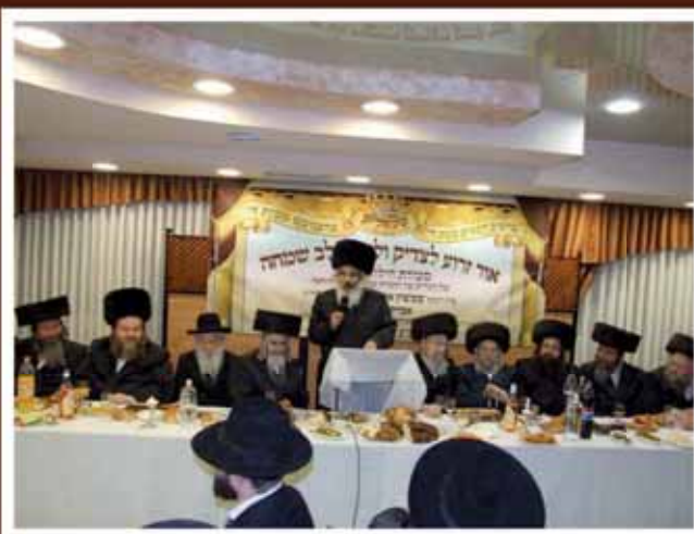
בסעודת היולולא אשתקד