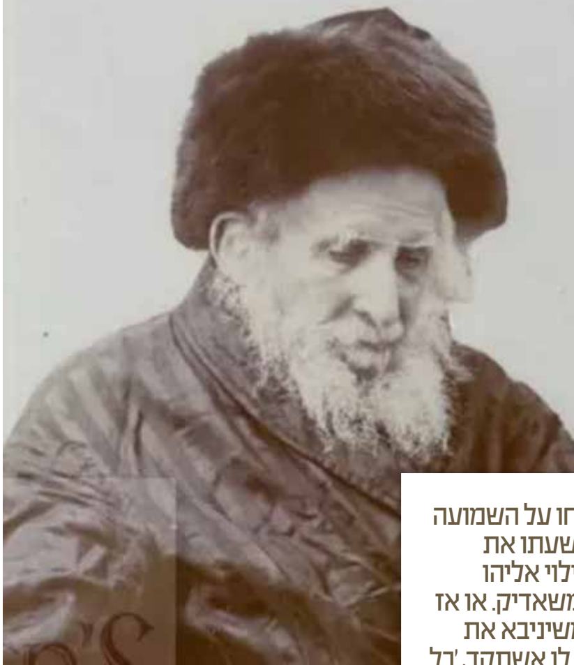
מרן הגאון רבי שמואל סלנט.