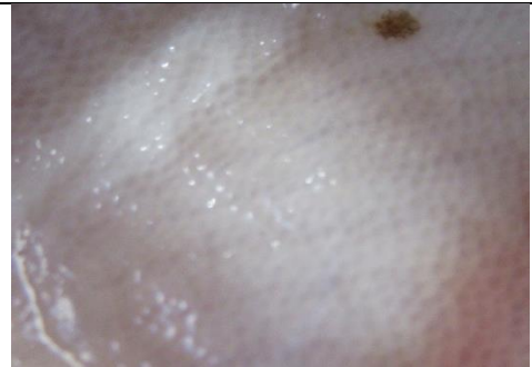
2. מראה עור הדג לאחר ההפשרה ניתן להבחין בקשקשים הקטנים שעל העור