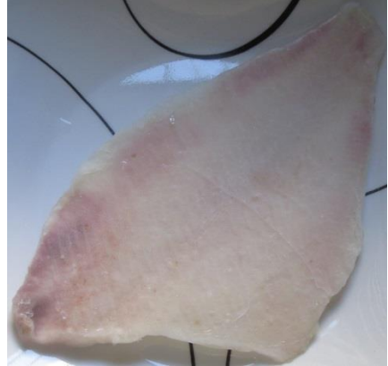
1. פילה דג סול בעודו קפוא - מצד העור