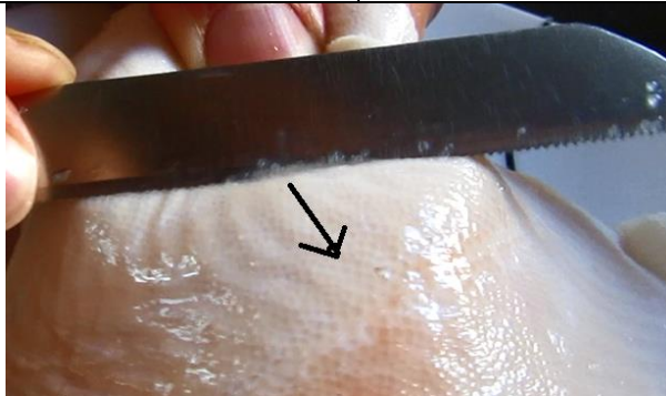
3. יש להעביר סכין בכיוון מנוגד לכיוון גדילת הקשקשים (מכיוון הצד התחתון לכיוון הצד העליון) ניתן לחוש ולשמוע מיד את התנגדות הקשקשים להעברת הסכין.