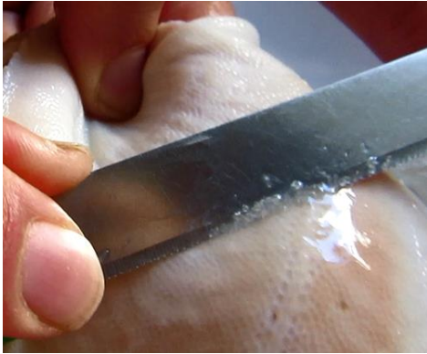
4. ניתן להבחין בקשקשים הקטנים המצטברים על גבי הסכין

רבים מתקשים בבדיקת דג הסול מחמת קטנות הקשקשים שלו, להלן תיאור הבדיקה: