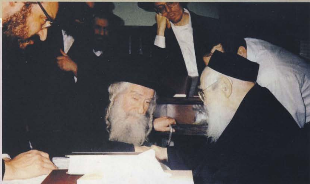
במעונו של ראש הישיבה רבנו הגדול מרן הגראמ"מ שך זצוק"ל