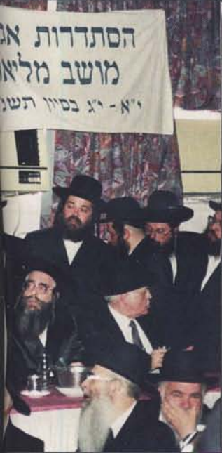
למעלה: עם בניו – הגר"מ (מימין) והגר"מ