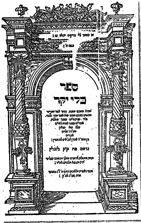
שער-בלאט פון ספר 'כלי יקר'