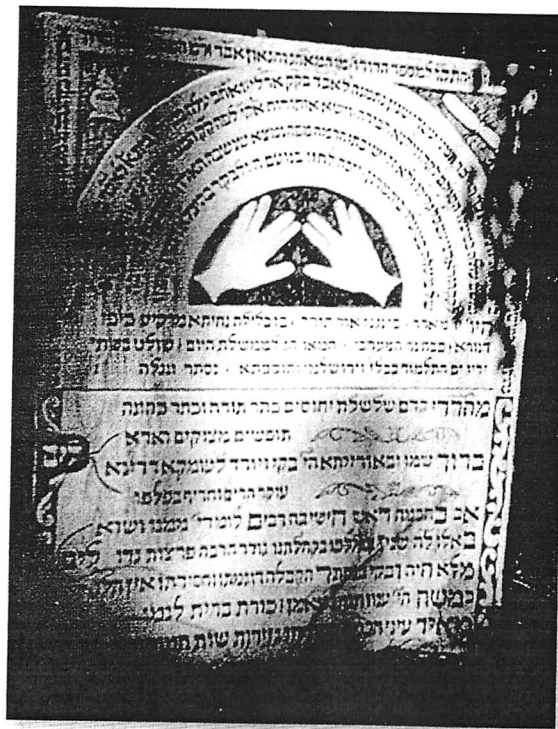
די מצבה פון הגאון ר' ברוך רפאפורט זצ"ל פון פיורדא

דאס ענין איז אבער נישט בלויז נשתנה געווארן ביי