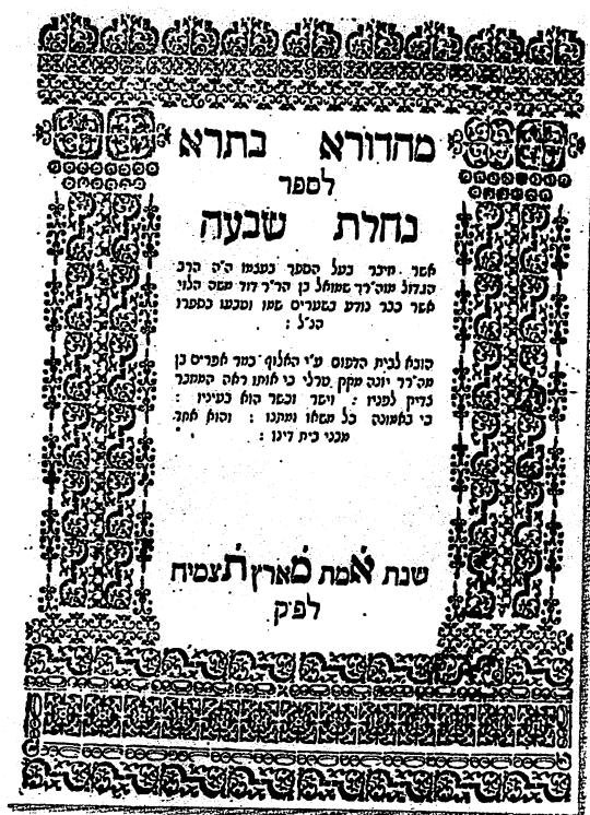
שער-בלאט פון ספר 'נחלת שבעה'

אזוי אויך טרעפט מען נישט קיין שופטים, נביאים, אנשי כנסת הגדולה, תנאים, אמוראים, גאונים, אדער אפילו ראשונים, וואס זאלן טראגן צוויי נעמען. 24