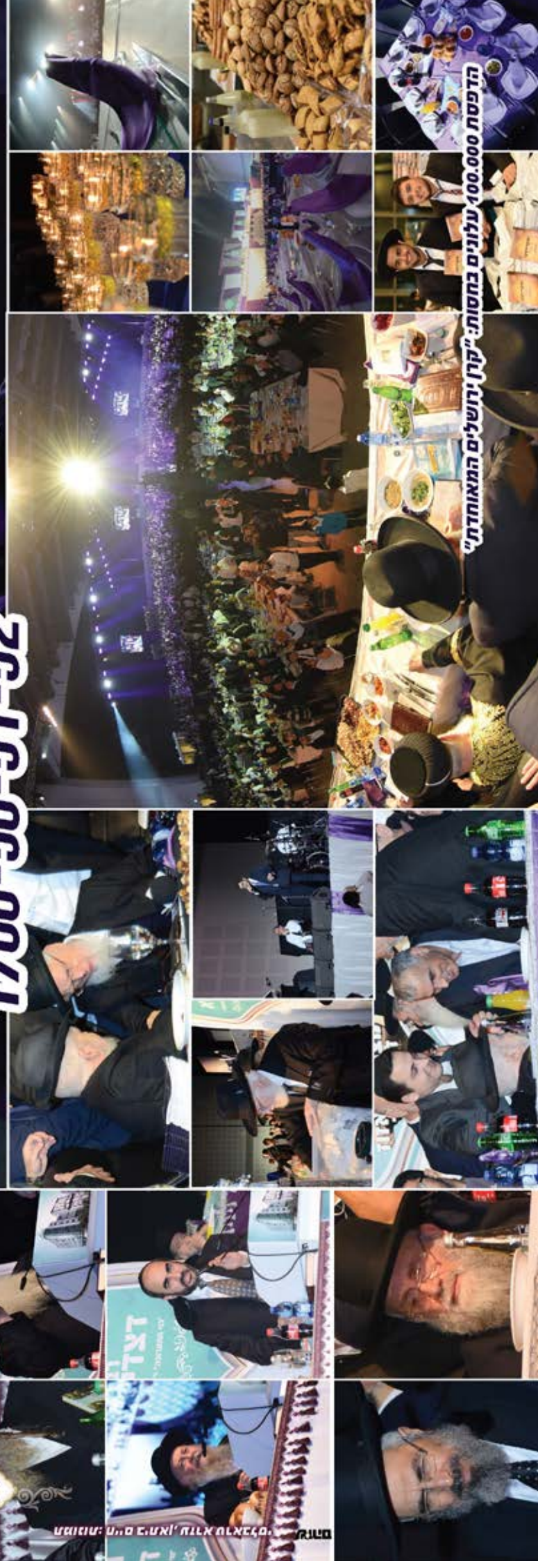
הדפסת 100,000 עלונים בחסות: "קרן ירושלים המאוחדת"