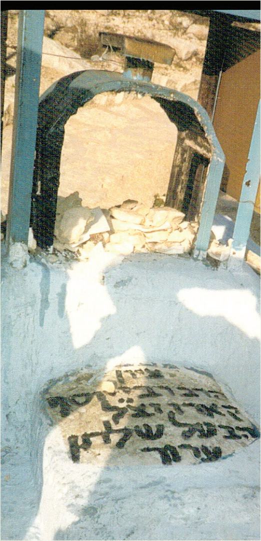
מצבת קבורת מרן הבית יוסף זי"ע בבית החיים הישן בצפת

ואכן, רבים מן היהודים יוצאי זיבנבערגן המקוריים, מקור מוצאם ממגורשי ספרד. [ראה בהרחבה על השתלשלות הדברים, בהקדמת הספר "דרך יבחר", וראה עוד שם אודות הרבנים הראשונים שם בזיבנבערגן שהגיעו לשם מטורקיה, כמו רבי יוסף אריזו וכן רבי אברהם ריסי ועוד, וקהילות אלו התנהלו בנוסח הספרדים – שהם היו הרוב שם עד שנת תק"ל. וראה עוד בספר "מקורות לקורות ישראל" – מאת הרב יקותיאל יהודה גרינוואלד – שנדפס ב"קאלמבוס אוהי"א" בשנת תרצ"ד – המתאר: "מקודם באו לקארלסבורג רק יהודים ספרדים, וכאשר שמעו בני ישראל כי יש מקום מנוחה בטרסילבניה נדדו שמה גם יהודים אשכנזים, אמנם הספרדים היו אז מראשי המדברים, ורוב הרבנים שם היו ספרדים, ופנקסי הקהילה נכתבו בכתב ואותיות רש"י כמנהג ספרד"...].