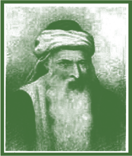
הציור הנפוץ של הבית יוסף זי"ע

"זה שיבוש גדול, ונתחלף לו משפחת 'קארו' במשפחת 'קרא'. והרב אביגדור קרא — אשכנזי בפראג, ובשנת קמ"ט, כנ"ל. והרב ר' יצחק קארו, ואחיו — הרב ר' אפרים — אבי ה'בית יוסף', הם ספרדים, מהגירוש דשנת רנ"ב, והיו ק' שנה — או יותר — אחר הרב ר' אביגדור