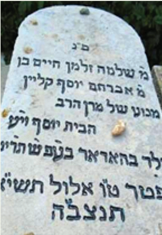
מצבת קבורתו של אחד מצאצאי משפחות שטיין-קליין אשר מצויין עליו היותו חוטר מגזע מורן הבית יוסף זי"ע