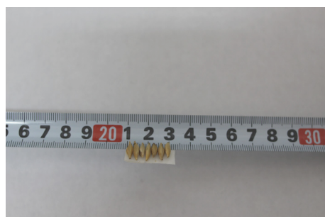
7 שעורות על צידן השוות ל- 2 שעורות לאורכן

מ"מ, מופרכת מעיקרה, 81 כי לא מצינו אצל גדולי הפוסקים העוסקים בדברי הרמב"ם הנ"ל, אפילו אחד שנוקט כי רוחב האגודל הוא פחות מ-2 ס"מ. הרמב"ם (בכורים פרק ו הלכה ט"ו) השווה את משקל הדרהם למדידת האצבעות, ולפיו רוחב 2 ס"מ לאגודל שווה למשקל הדרהם שהוא 3.2 גרם , כפי שביארנו בהקדמה לקונטרס, וראה לקמן באות כ"א.