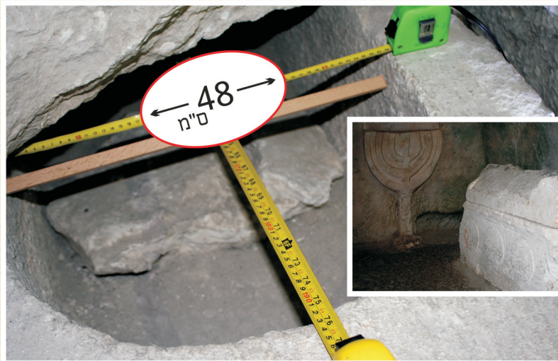
ארון קבורה בבית שערים אורכו 192 ס"מ רוחבו 48 ס"מ, עיין עמוד 38 ועמוד 49