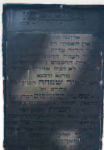
מצבת המשך חכמה שהיה רב בדווינסק וקברו הועתק יחד עם רבני דווינסק לחלקה החדשה

הגאון עצמו סיפר בחייוך אודות ביקורו אצל הרבי הזקן מסוכצ'וב [בעל ה"אבני נזר"], שבצערותו נכנס אליו ואמר לו שהוא - מי שנודע לימים כ"גאון מדווינסק" - בקי במחצית הש"ס.