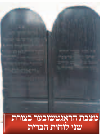
מצבת הראג'טשובער בצורת שני לוחות הברית

בינתיים נתקיימה ה'טהרה' ביום שישי בשעה 6.30 בבוקר, בבית "צעירי אגודת ישראל" המקומי. מרגע בואו של הגאון לווינה, יצרו "צעירי אגודה" סביבו מעין "משמר אישי" ומישו אותו במסירות רבה. עתה קיבלו עליהם "צעירים" את התפקיד להסדיר את כל ההליכים הדרושים.