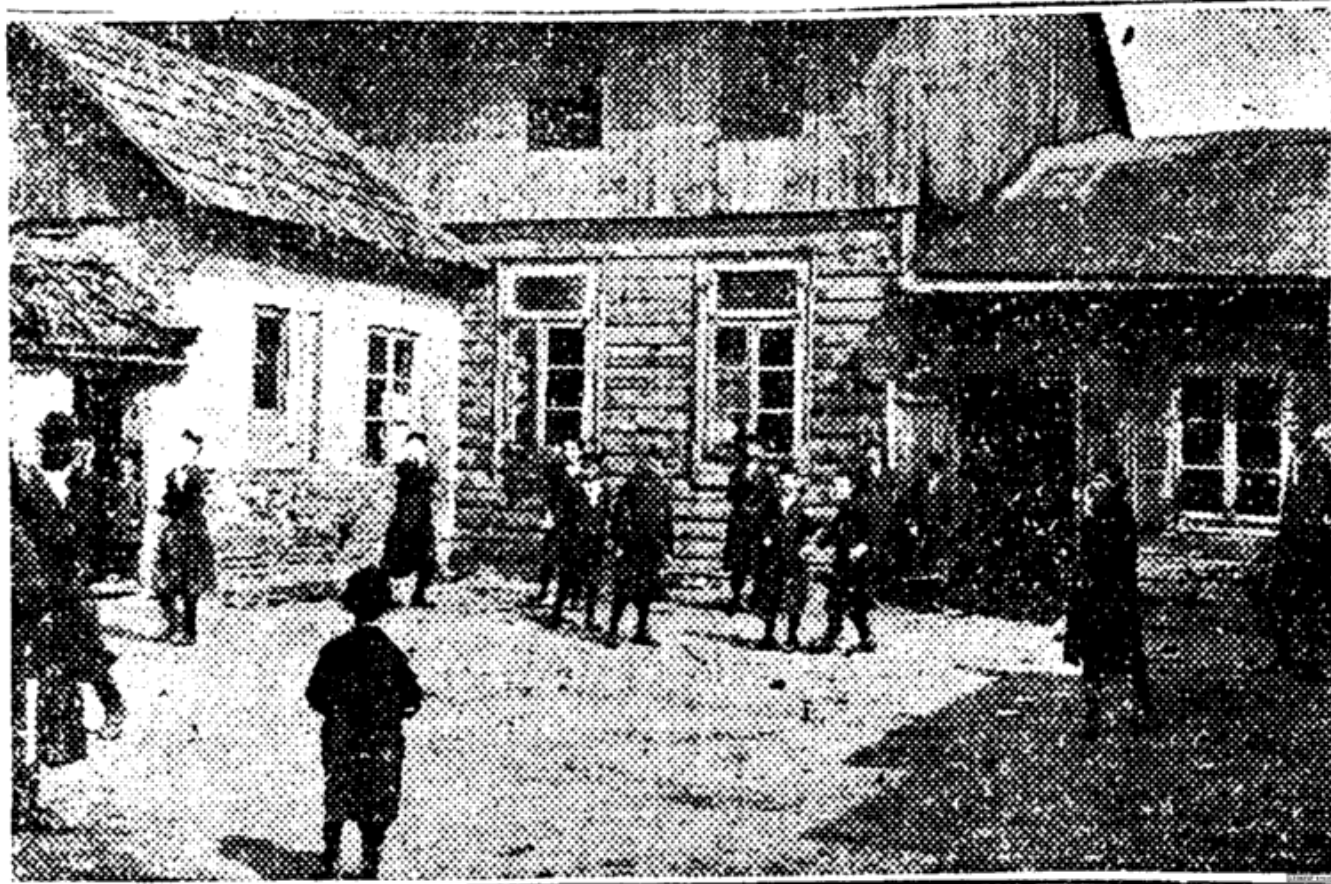
בחורים בחצר בית המדרש באלכסנדר. בשנת תר"ץ.