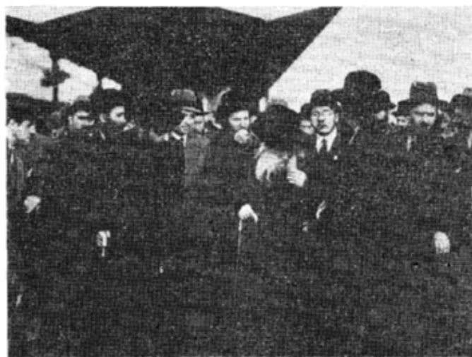
באחד המסעות לארץ-הקודש (אח"ח 1234567)