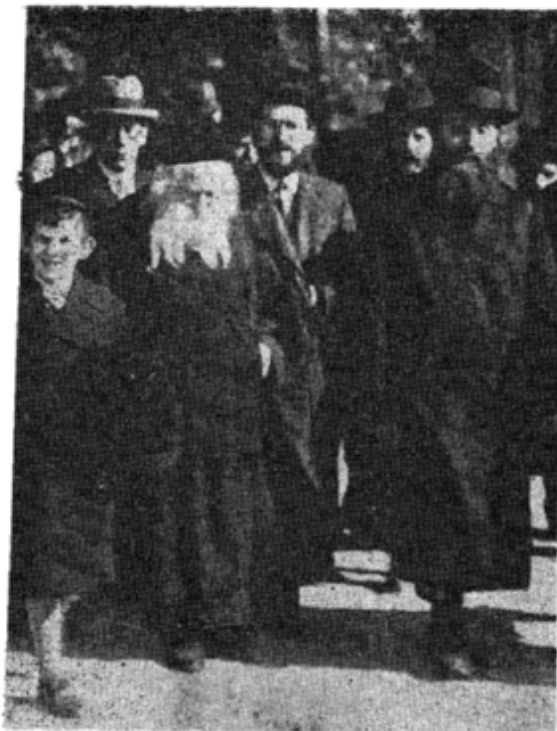
האדמו"ר מגור זצ"ל באחת מנסיעותיו התכופות לארץ-הקודש — בחבורת בני-לוייתו

שלו, כי, "מאורעות יפו הם צרה" וכי כתוצאה מכך, "עוכבה בנתיים העליה לארץ-ישראל", ומאידך גיסא, הלא חרף כל זה עמד והכריז האדמו"ר באותו מעמד, כי, "עת לעשות היא כשביל הישוב היהודי בארץ ישראל" ואת קריאתו זו הופנה מעל לכל, למי שיש בידו להתחייב שם, ופס זאת תבע פאלה שאין ביכולתם לעשות כן — להשקיע לפחות מרכושם בארץ ישראל, ואמנם כן, כיצד קבעו ואמרו ה"פעילים אכולי-שנאה ונמוליי-בושה? הרבי מגור נקט בעמדה שלילית לגבי בנין ארץ-ישראל? —