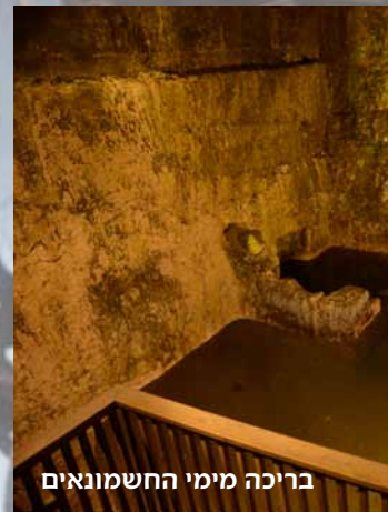
ברכה מימי החשמונאים