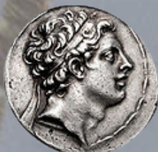
אנטיוכוס אפיפאנס הרביעי

169 לפנה"ס. העולם כולו סער ורגש לרגל אירועים על טבעיים שהתרחשו. תחילה הקדמה קטנה: יוון של אותם ימים הייתה אימפריה עצומה וחזקה, בראשה עמד קיסר גדול חזק ותקיף מאוד בשם אנטיוכוס אפיפאנס הרביעי. הוא כבש מדינות רבות ומלכים חזקים, החריב את טירותיהם, שרף את היכליהם והשליך את כל בכירי הממלכות הכבושות לבית הכלא. עדויות מאותה התקופה מספרות, שמימי אלכסנדרוס המלך לא קם מלך כמוהו. הוא בנה לו מדינה גדולה על חוף הים שתהיה לו לבית מלכות, וקרא לה מדינת אנטיוכיא על שמו. משם הוא שלט ביד רמה על כל ממלכתו.