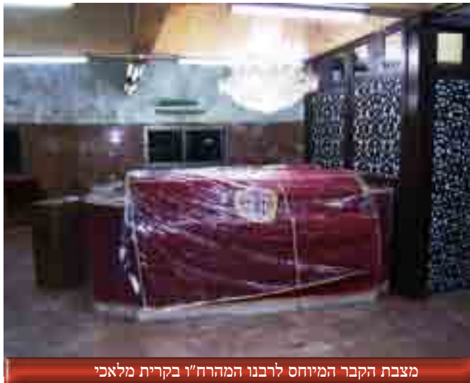
מצבת הקבר המיוחס לרבנו המהרח"ו בקרית מלאכי

לעומת זאת ישנה עדות של רבה האחרון של סוריה הרב אברהם חמרה שעלה לארץ בשנת תשנ"ד והוא טוען כי כל עוד שההוא התגורר בסוריה לא נגע איש בקברו החדש של המהרח"ו, וכך הוא מספר השבוע בשיחה