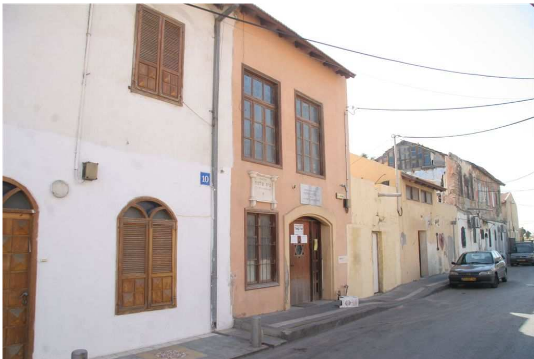
שורת הבתים הראשונה של "נוה שלום". בקצה השמאלי ביהכנ"ס "קהל חסידים"

"אמת, אבל התורה מלמדת אותנו להתעלות ולנהוג לפנים משורת הדין ולדון כל אדם מישראל לכף זכות" השיב הוא לעומתה וניגש לקדש על היין בפנים זוהרות.